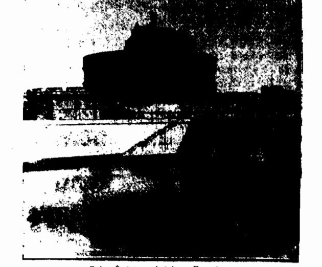
Pałac Świętego Anioła w Rzymie.