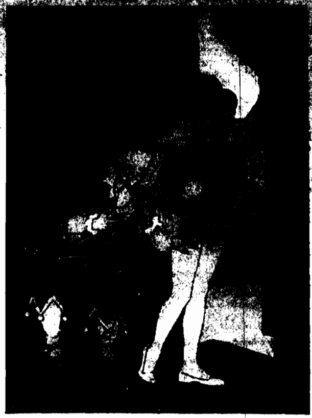
Rozruszał się dziś starowina, Zapomniał strzykania i bóle, I błagał tak piękna zaczyna: — Daj raczkę! Do ust nuch przytulę! Włec aby się raz pożył kramu, Na prochy starego się zgodzi I raczkę całował swą da mu... A potem? A potem są młodzi!

Po długim oczekiwaniu użrzano wreszcie wczoraj na ekranie Juliana Igo Syma, męską gwiazdę kinematografii polskiej, w sensacyjnym i doskonałym obrazie produkcji wiedeńskiej p. t. „Dziewczątka z Prateru”. Sym stwarza tu wysoce dramatyczną postać mężczyzny, który znalazł się w pętach demonicznej kobiety. Jako jej ofiara i którego z jej objęty wyrzyna niewinne i wiosniane „dziewczątka z Prateru”.