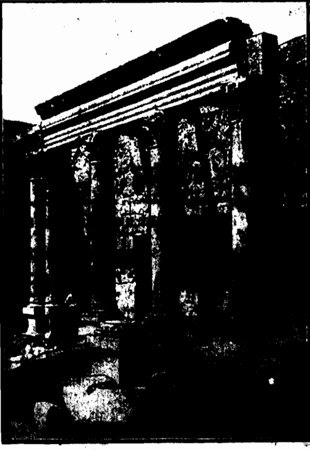
Rząd palestyński przystąpił do odbudowy wspaniałego zabytku młonoj świetności — prastarej synagogi w Kaironaum.