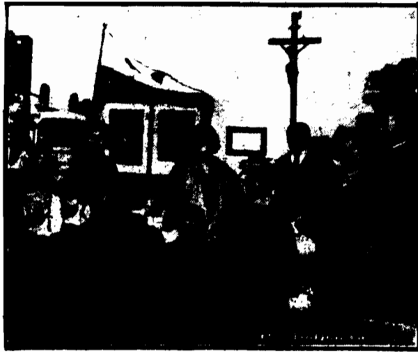
Rozdawanie darów gwiazdkowych w Jastarni, przywiezionych przez delegację z Warszawy