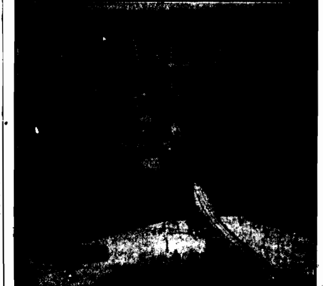
Nad zatoką Hudson w Ameryce Północnej zbudowano ten most, liczący około 8 klm. długości. Biegnie on aż do portu Nelson, który w ten sposób stał się ważnym punktem komunikacyjnym.