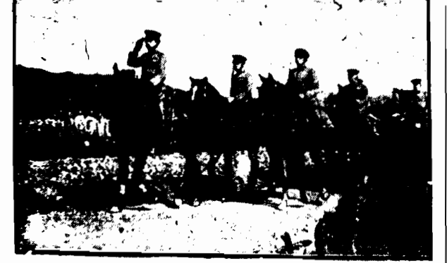
na prosię dzie skautów