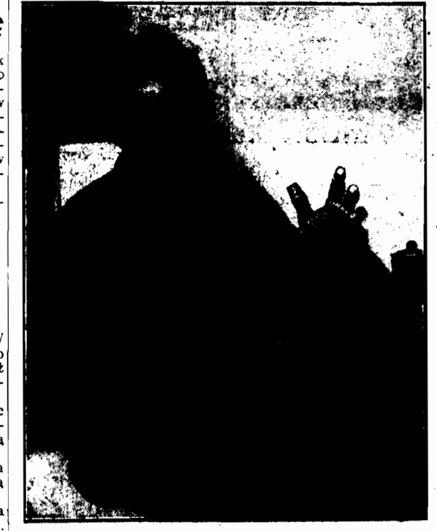
Tarka i naparstek — oto ostatnie instrumenty muzyczne, jakimi się posługuje jazz-band na Zachodzie.