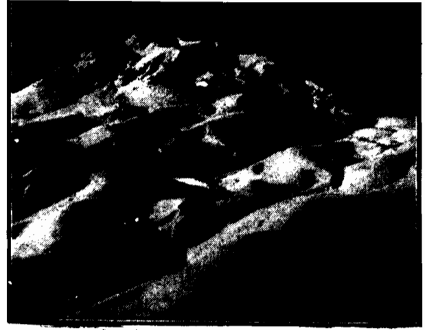
Tereny narciarskie w Zakopanem