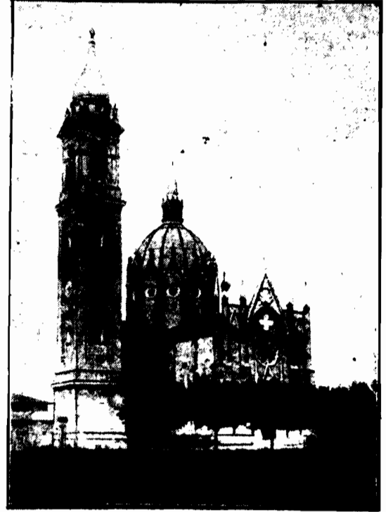
we wsi Venezia, połonem opodal Bolonii, poświęcono w tych dniach świeżo wykonany kościół, którego budowę od fundamentów aż do wierzchołka wykonał jeden człowiek w ciągu 40 lat swego życia.