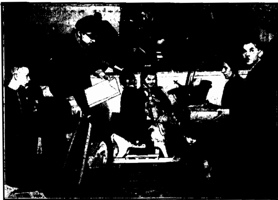
Na „Gwiazdce” dla dzieci bezrobotnych, urządzonej przez Czytelników warszawskiego „Expressu Porannego”, harcerze rozdają podarki, uszczęśliwionym malcom.