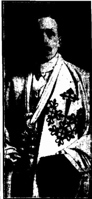
Jako wielki mistrz Kapituły Orderów S. Jago, Calatrava, Alcantara i Montesa