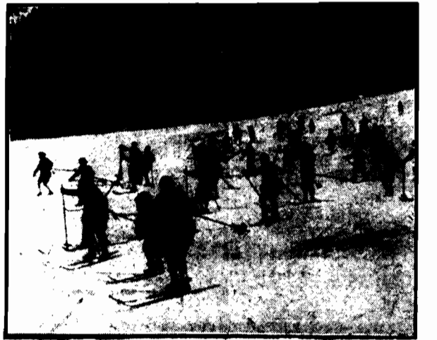
Narciarstwo w Davos