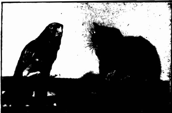
W przykładowej zgodzie w berlińskim ogrodzie zoologicznym.