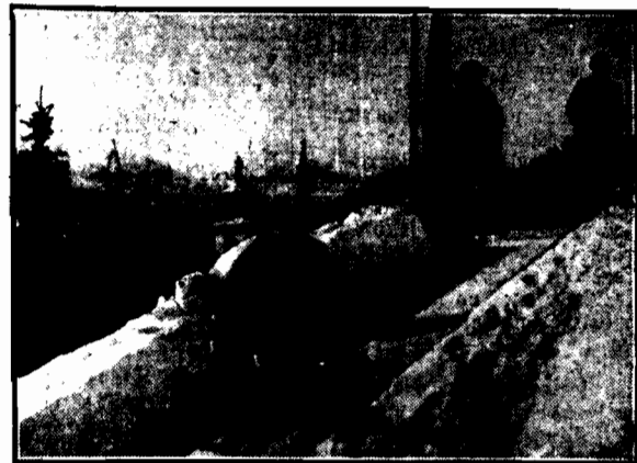
Sezon sportów zimowych rozpoczął się w całej polsce