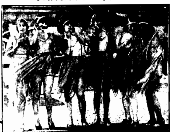
Grecczanki przed występem kończą swą toaletę w sposób nieznanym w starożytnej Grecji