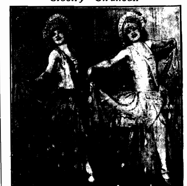
zdobyły główną nagrodę w Nowym Jorku na konkurs najpiękniejszych siostr. Rozstąpiła się w kłębnie.