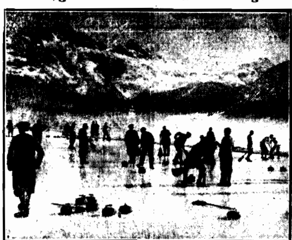
Szlifowanie lodowej powłoki białego jeziora górskiego