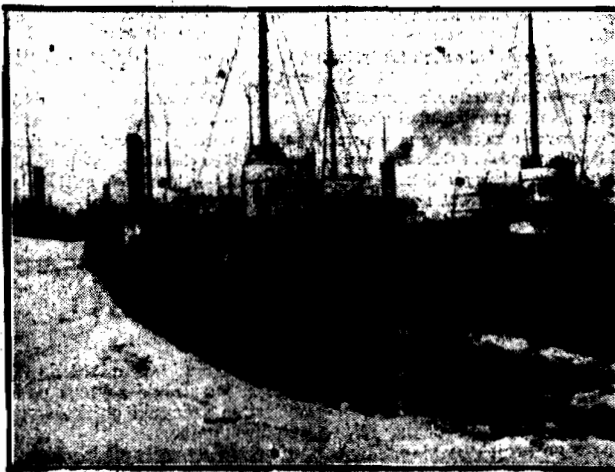
200 okrętów uwiecznionych zostało na reese St. Mary przez niespodziewany śnieg zimny. Rozbudził je dopiók o specjalny okręt, kruszący lody.

Naprzód konsulatu, później dziennik Sowiecka inwazja w Gdańsku