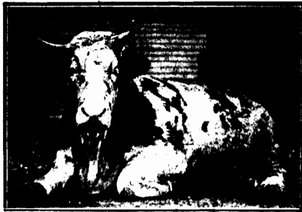
W nowojorskim ogrodzie zoologicznym znalazł przytułek na konice pracowitego żywota wół-okaz. Waży nie mniej, nie więcej tylko oko- ło 8.000 kilo.