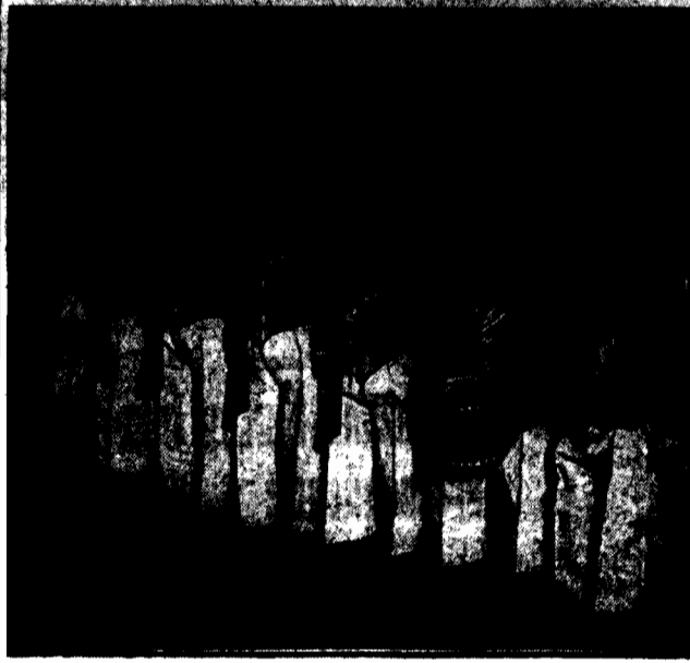
występuje obecnie z wielkim powodzeniem w Berlinie.