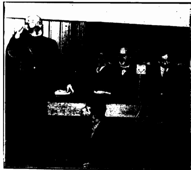
W czasie dyskusji w Moskwie. Miecz: polittechnika, temat: Po- przewodniczy Kamieniem. Obok przychodzą — mówca