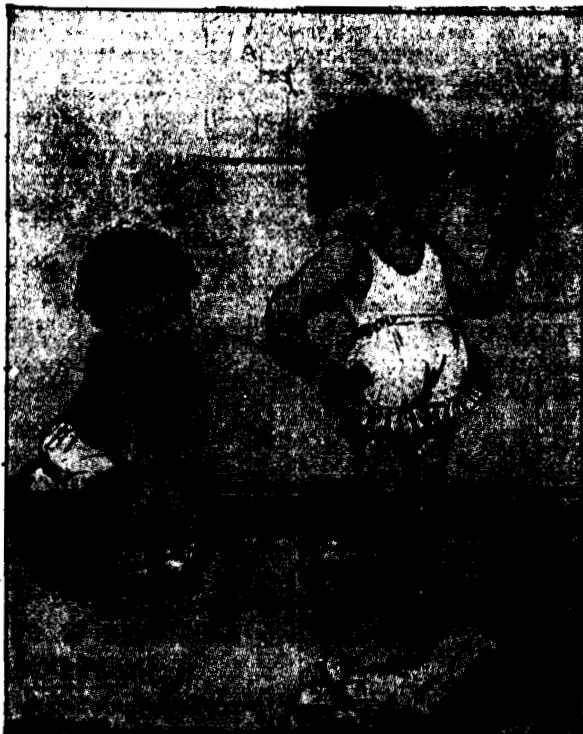
Coś mi do twarzy z tymi młotkami?