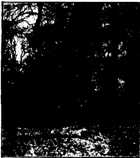
Dąb obrzym, liczący 275 lat w lasku białym pod Warszawą.