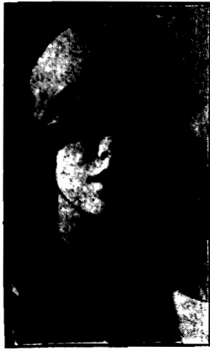
Widano podczas tegorocznej... studenci.

Widano, jak rósł w tych latach paryski odrywający się od... Należał do każdego rogu ulicy... W Paryżu ostryg... Jednego z takich smakoszy