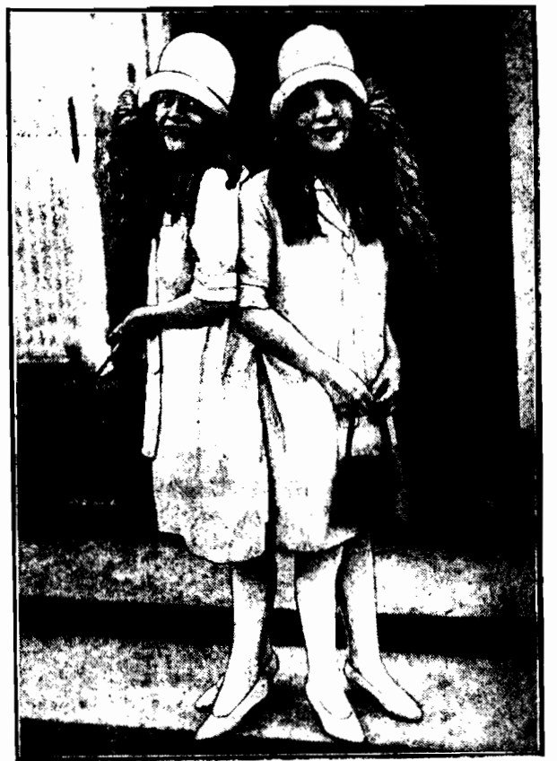
DWIE ZROSNIE TE BLIŹNIACZKI zostały przyjęte w Białym Domu przez prezydenta Coolidge'a.