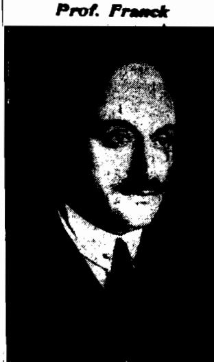
chemik niemiecki z Göttingen, który otrzymał tegoroczną nagrodę Nobla.