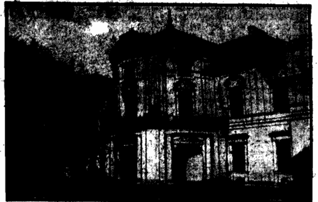
Pałac hr. Jamsza Radziwiła w Warszawie, przy ul. Białej.