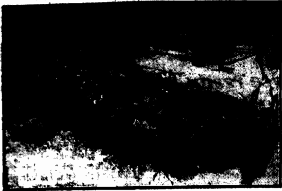
Mogila znakomitego pisarza na cmentarzu ewangelicko-reformowanym.