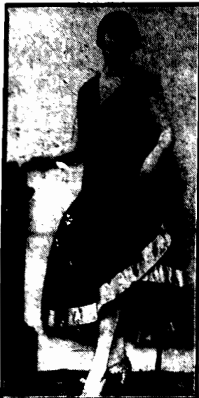
Kasztanowatego, przybrany haftem z szarego jedwabu.