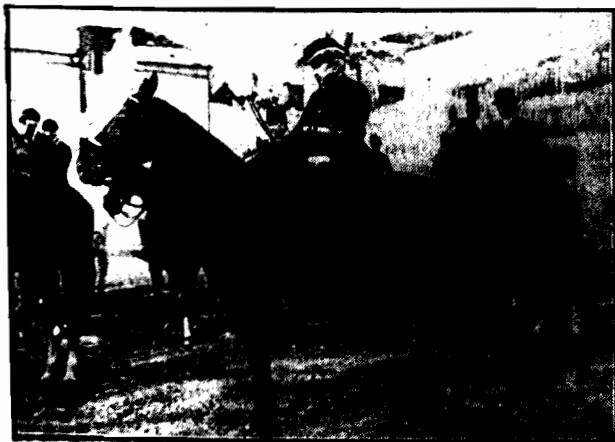
Choć mimo podeszłego wieku bierze udział w polowaniach z charakterem.