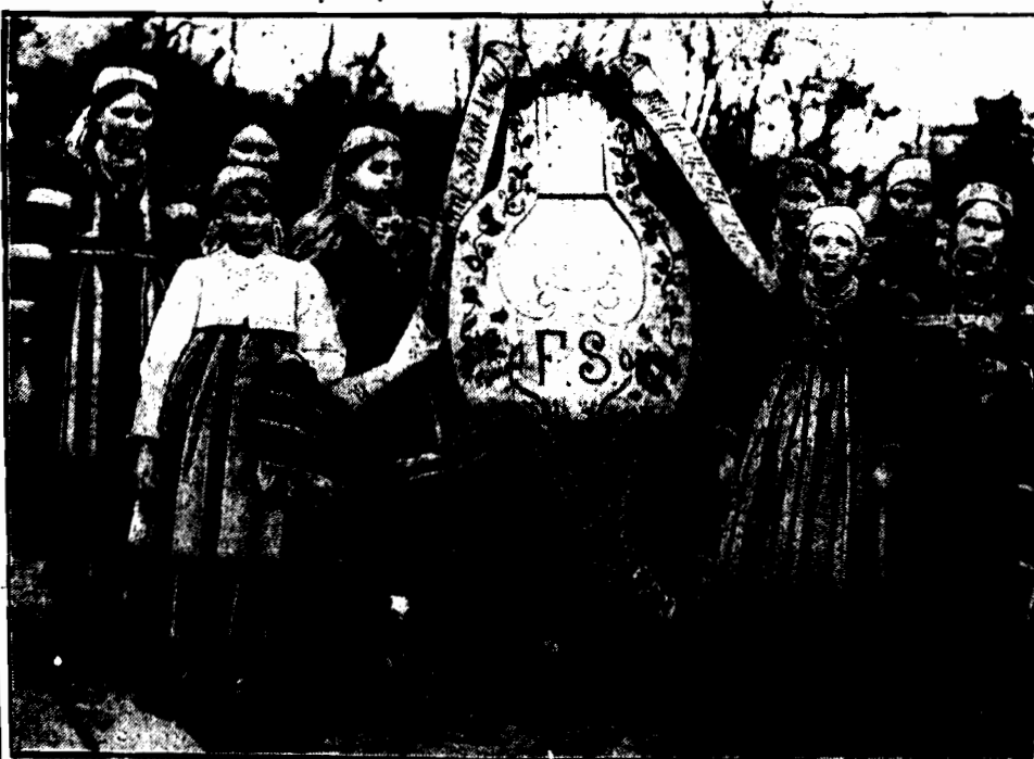
Wieniec od wiościian z Żelazowej Woli - miejsca prożenia Chopi