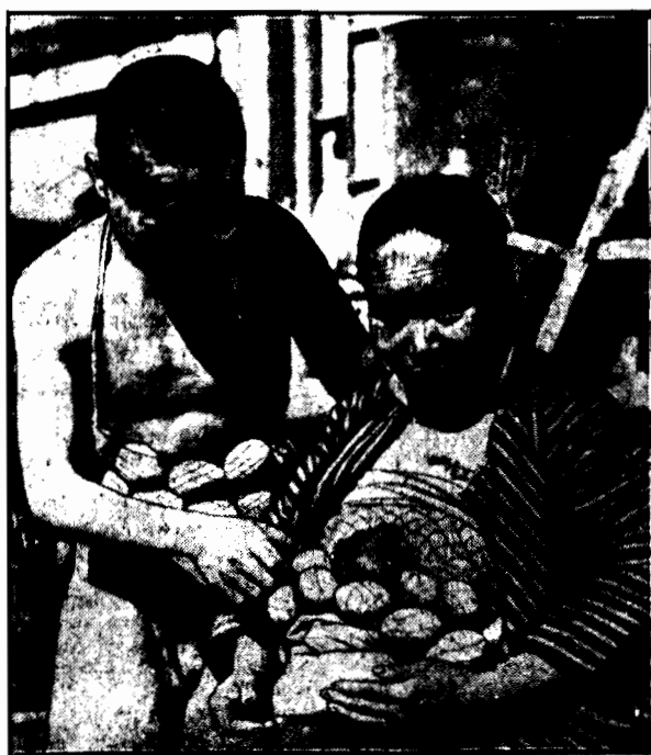
Takim zajęciu oddaje się specjalna kasta ludzi. Noszą oni jajka przytwierdzone w specjalny sposób do pasa nieraz po trzy dni, aż kacze przebiją skorupę dziobem. W ten sposób przychodzi na świat specjalny gatunek kaczek, przeznaczonych dla smakoszyw chińskich w Pekinie.