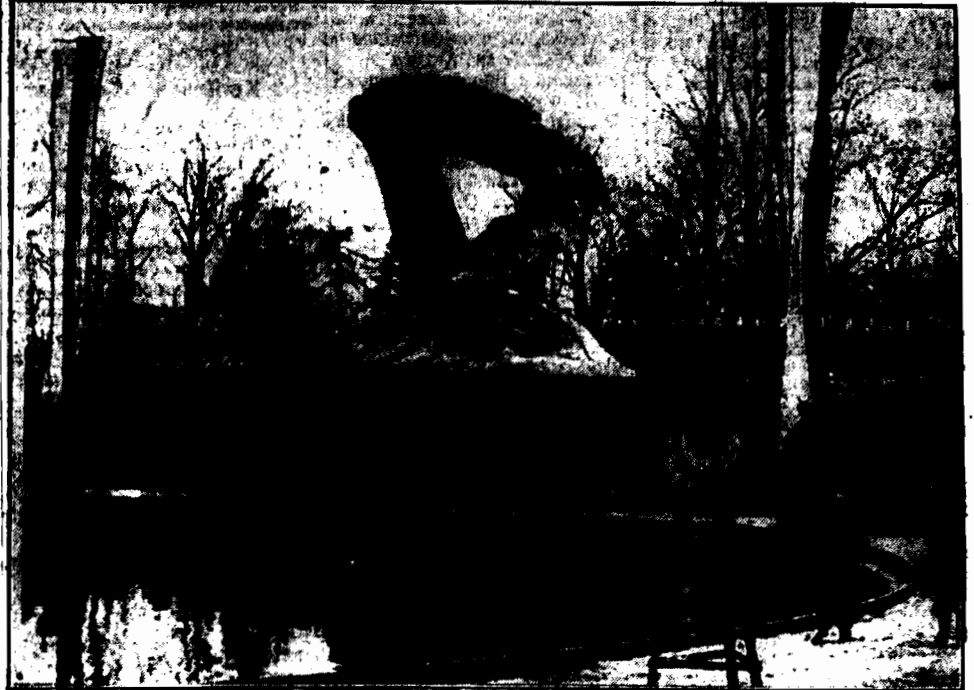
Chwila usunięcia zasłony