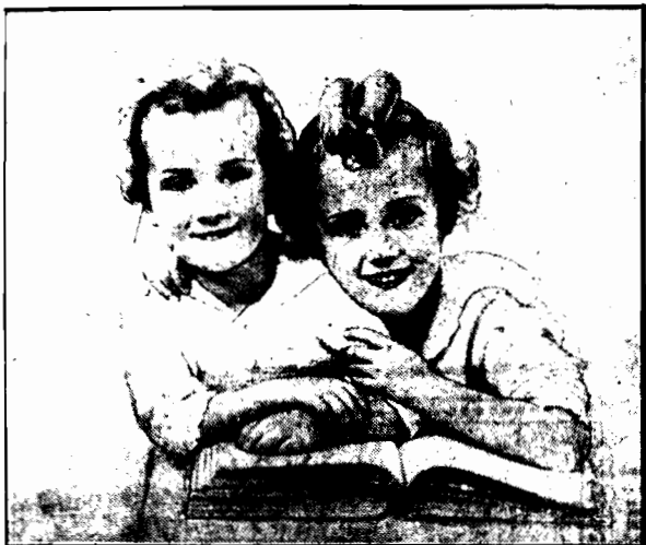
Księżniczka duńska, którym przypadł w udziale zaszczyt niesienia tronu na uroczystości zaślubin księżniczki Astrid szwedzkiej i księcia Leopolda belgijskiego