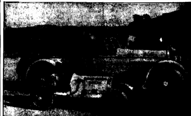
Te dwa samochody są własnością aktora filmowego Hobo. Na obu można osiągnąć szybkość 180 kilometrów na godzinę.