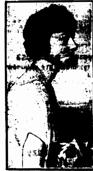
Kierowniczka szwadronu, której siódmiu z następcami straciła życie, odbędzie się dziś