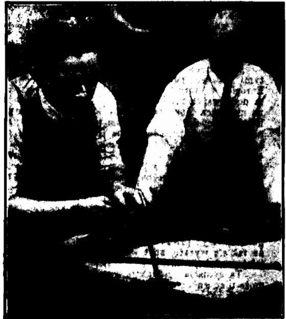
z zębów jadowitego weża, w brazylijskim laboratorium doświadczalnym przy pomocy specjalnego przyrządu.