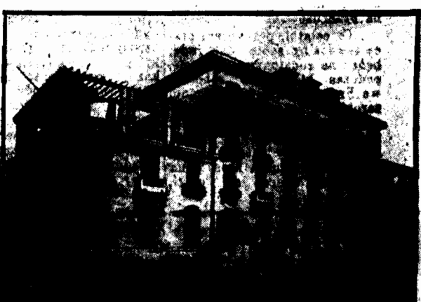
W Paryżu dokonano otwarcia Domu akademickiego dla Kanadyjczyków, studiujących w uniwersytecie paryskim.