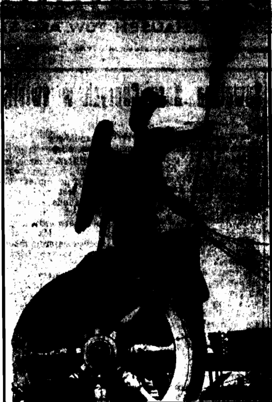
Aby zobaczyć interesujące dzieło, wdrapał się na szczyt pomnika. Dzieci to w Monachjum