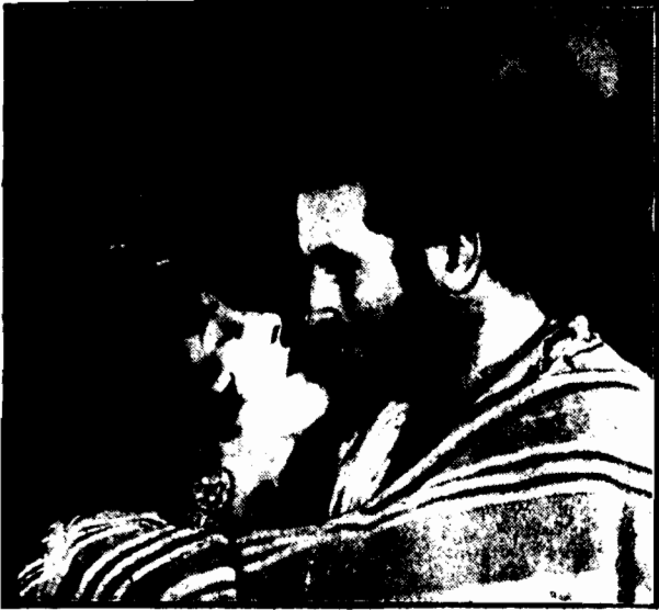
Nowy ham! w którym główne role odwarzają Patsy Ruth Miller i Richard Barthelmess