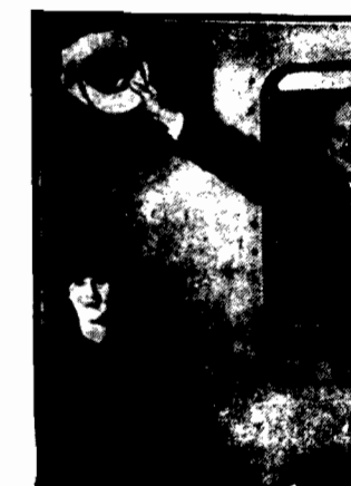
Znany artysta (filmowy) Emil Jannings, wyjechał na 6 miesięcy do Ameryki, zaangażowany na szereg występów przez wytwórnię Paramount.

tem oltarz w kościele św. Jana w Nowym Jorku.