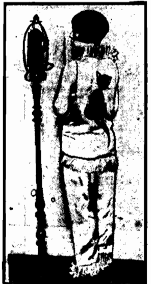
Jest najnowszym kaprysem mody amerykańskiej.