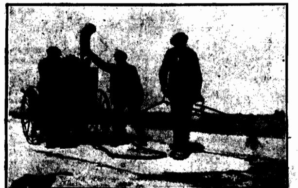
stosuje się pod Wilanowem. Powierzchnię szosy po dokładnem wystudzeniu polewa się kilkakrotnie smolą i posypuje twierdym, co zabezpiecza ją przed wilgocią.