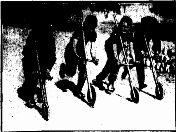
w wyścigi drow nanych kółek.