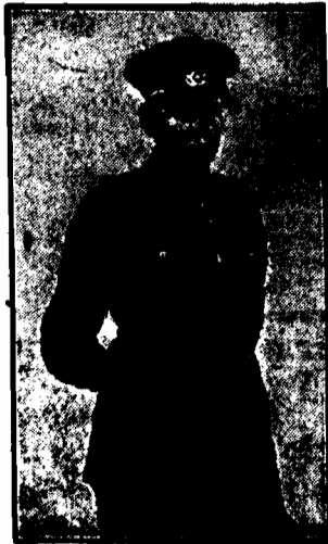
komendant niemieckiej Reichswehry w dymisji.