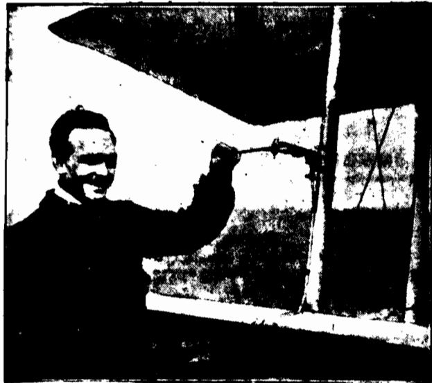
Na wszystkich nowoczesnych samolotach francuskich znajduje się mały aparat, który automatycznie ostrzega lotnika o każdym skrzywieniu aeroplanu i w ten sposób umożliwia w znacznym stopniu spokojny lot.