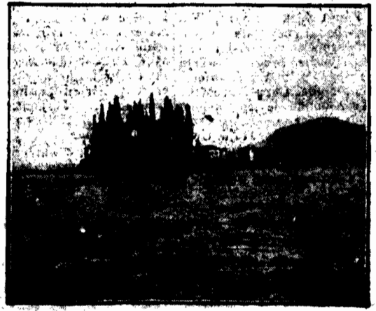
Wawilonej obrazem Böcklina małej wyspce greckiej „Pontikonisi”, znanej na całym świecie jako „wyspa umarłych”, grozi zagłada z powodu kruszenia się jej skałki ze zrumia-