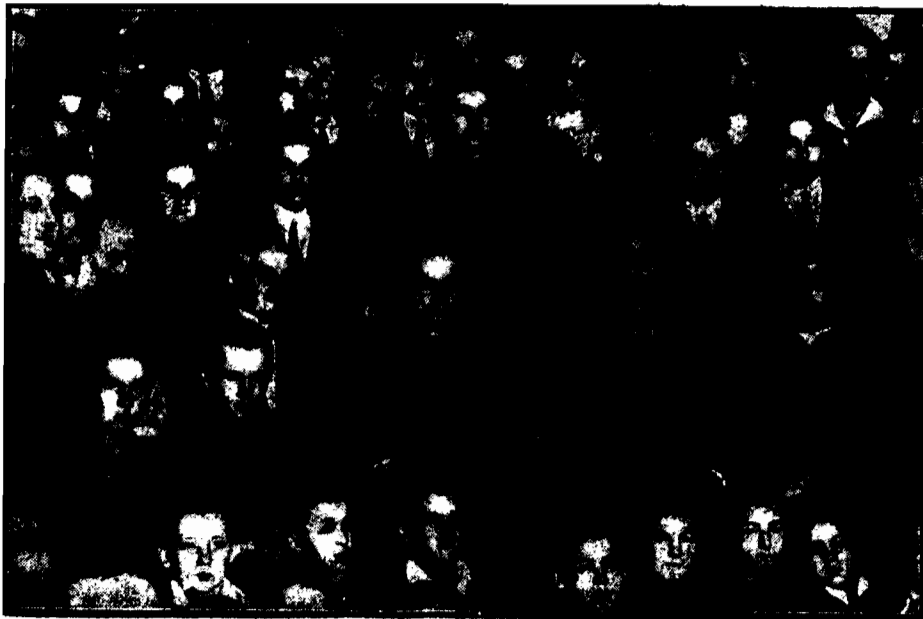
Przed uroczystym ingresem do Poznania prymas Polski ks. Hlond bawił przez kilka dni w Warszawie. Między innymi odwiedził zakład dla sierot ks. Siemca, którym opiekują się O.O. Salezjani. Zakład ten jest Jego sercu szczególnie bliski, bo sam kiedyś do tego zakonu należał.