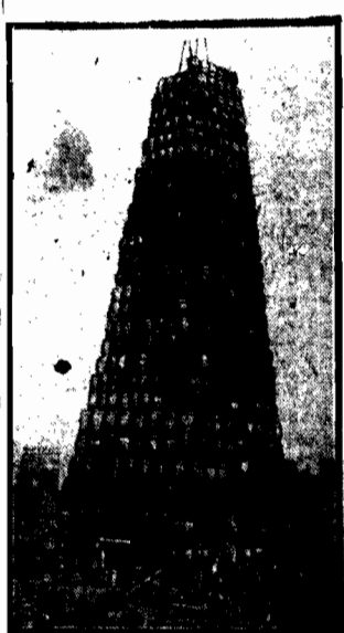
W Bostonie zbudowano wieżę i boczny na używanie jednego innego malownika