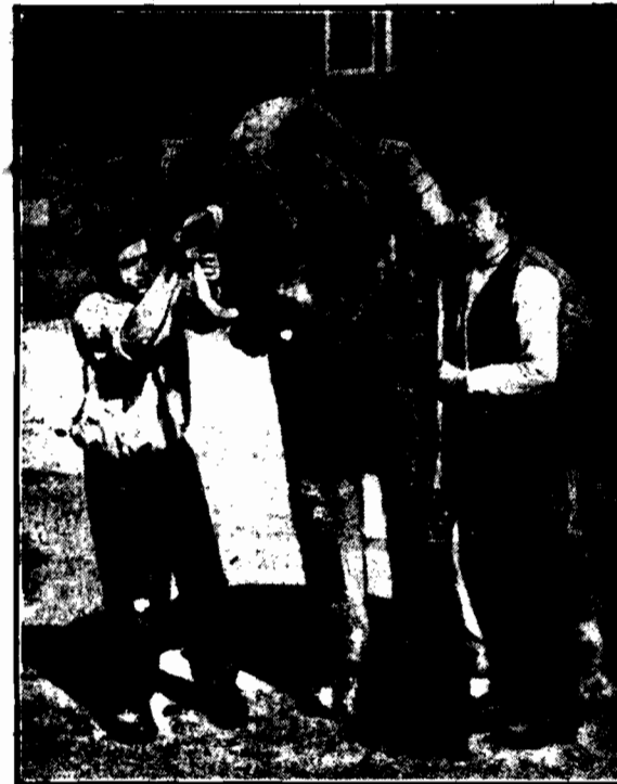
W londyńskim ogrodzie zoologicznym czyści się kły słonjowi specjalna ściereczka.