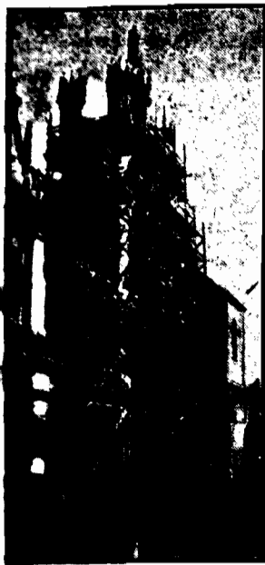
Przebiegający rzeźbiony zabytek sztuki gotyckiej z okna kamiennego odrestaurowanego.