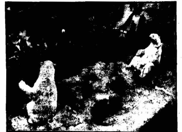
Bele — niedźwiedzie w londyńskim ogrodzie zoologicznym aportują, za co publiczność darzy ich smaczkami kaskami.