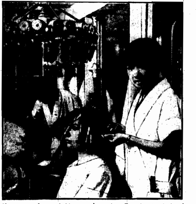
Nowoczesna fryzura kobieca spopularyzowała się nawet w Chinach. Cały szereg fryzjerek, wykształconych w Europie, strzyże i onduluje swoje rodaczki.