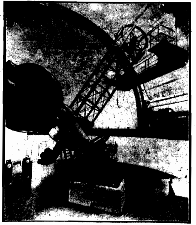
w obserwatorium astronomicznym w Wiktorji, Kolumbia Brytyjska.