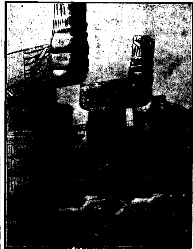
W środkowej Ameryce, na półwyspie Yukatan, oczywiście prastarego indyjskiego szczepu Maya, dochowały się do dnia dzisiejszego ruiny wielkiego miasta — Chichen Ytza.

Na zdjęciu widzimy wejście do pomników różnych gmachów i historię wielkiego szczepu indyjskiego o niesłychanie wyścigłej kulturze.