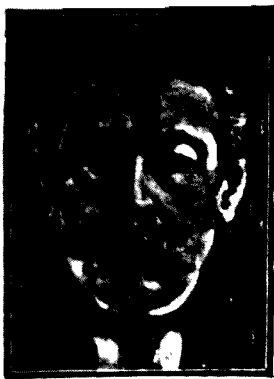
zawsze — Arystydes Briand, szef delegacji francuskiej.