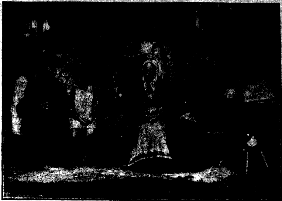
Grupa kobiet umysłowo chorych w zakładzie w Górze Kalwarji pod Warszawą