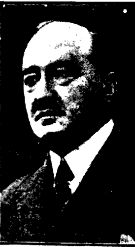
Vicente Blasco Ibañez, zapalec republikański, antyklerykał i socjalista, autor świetnych powieści i romansów uchodzący za największego wroga dyktatora Primo de Ribery.

Skazany na banicję, przebywa obecnie w Francji.