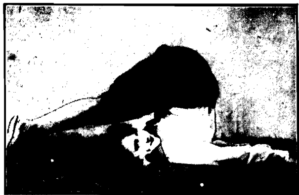
Aby utrzymać swą linię amerykańska gwiazda filmowa, Estella Clark, co rano wykonuje niezwykle skomplikowane ćwiczenia gimnastyczne.