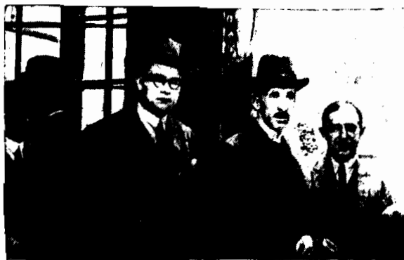
DELEGAT POLSKI MIN. SOKAL

(w palcie w czarnym kapeluszu) w otoczeniu dziennikarzy.