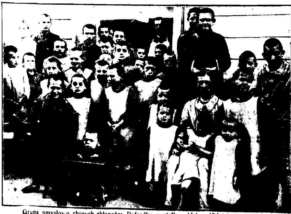
Grupa umysłowo chorych chłopców. Pośrodku w stolku widzimy 18-letniego potworka.