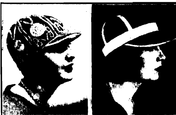
W ostatnich czasach tenisistki angielskie zaczęły używać zgrabnych czape- czek azurowych z daszkami, zabezpieczającymi oczy od promieni słońca.