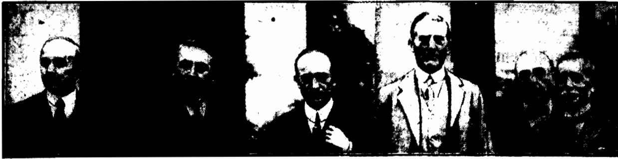
RADA LIGI NARODÓW

POLSKA W TEORNI MA MOŻNOŚĆ UBIEGANIA SIĘ O MIEJSCE W RADZIE LIGI — W PRAKTYCE 17 PAŃSTW GERMANOFILSKICH MOŻE JĄ ODSUNĄĆ OD STERU POLITYKI ŚWIATA