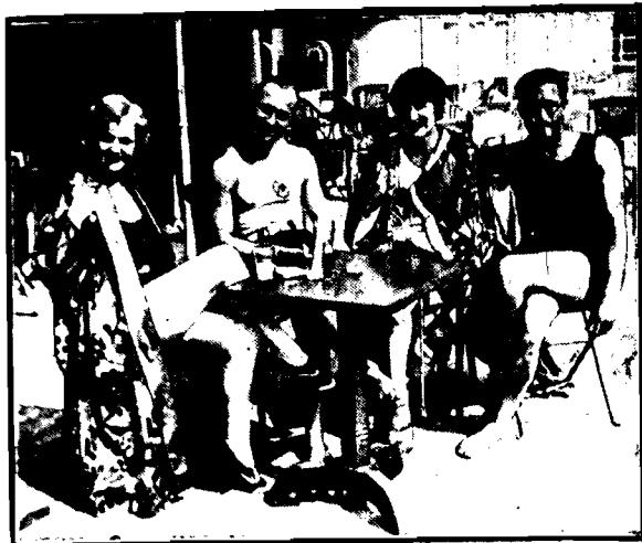
Scena z towarzyszą londyńskiego państwo Bakem i państwo Kidman.