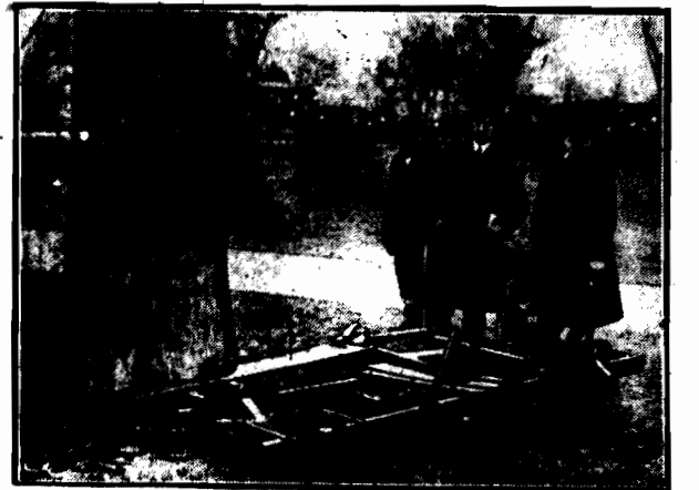
Piła do ścinania drzew poruszana motorkiem