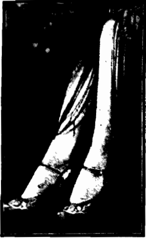
OSTAŃNIA MODA strona leżące więcej suknie, wprowadzanie do nich długie frendzle dla osłony nagości

Złoczyńca ten był prawą ręką groźnego bandyty Rysia i nosił nawet miano adjutanta. Ryś stał na czele bandy rabunkowej, która przez osiem lat, od r. 1918 do 1926 grasowała na terenie powiatu święciańskiego, na Wileńszczyźnie krwią i ogniem znacząc straszliwy szlak mordów, grabieży i napadów.