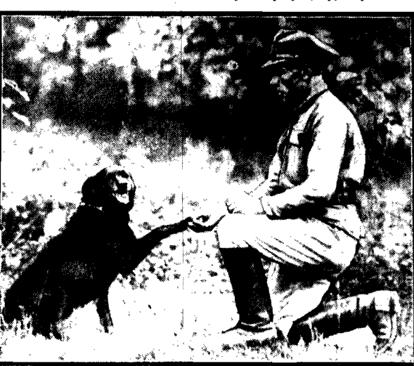
Pochwalony za dobre spełnienie rozkazu owczarek meldunkowy podaje zgodnie z psią etykietą łapę swemu przewodnikowi.

Koń od niepamiętnych czasów jest wiernym towarzyszem człowieka w boju — pies w ostatnich wojnach zdobył opinię niemień wiernego i pożytecznego zwierzęcia.