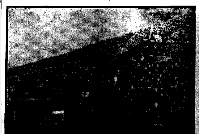
Najdalej wysunięta na polskim wybrzeżu morskim stacja kolejowa — Białogłowa.