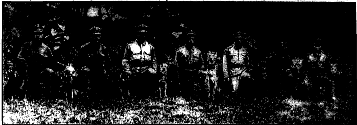
Baczność! Żołnierze z psami przykłękają na prawe kolano i trwają tak w oczekiwaniu na rozkaz ruszenia z meldunkami.