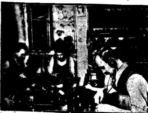
W stryżnym wprost szwedzkim słuchanie wykładu i koncertu radiowego nie przerywa pracy.