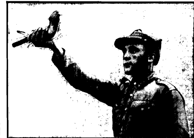
Rzut w górę zamiast rozkazu; pędz z meldunkiem.

1-szy pułk łączności w Zegrzu, prócz psów meldunkowych, utrzymuje wzorową stację gołębi pocztowych, o których już niejednokrotnie ciekawie rzeczy opowiadał Czytelnikom „Expressu Porannego” por. Sowa, komendant stacji gołębi nr. 1 w Warszawie.