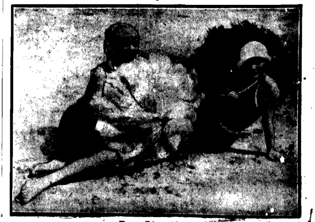
Baseniki s. 64.