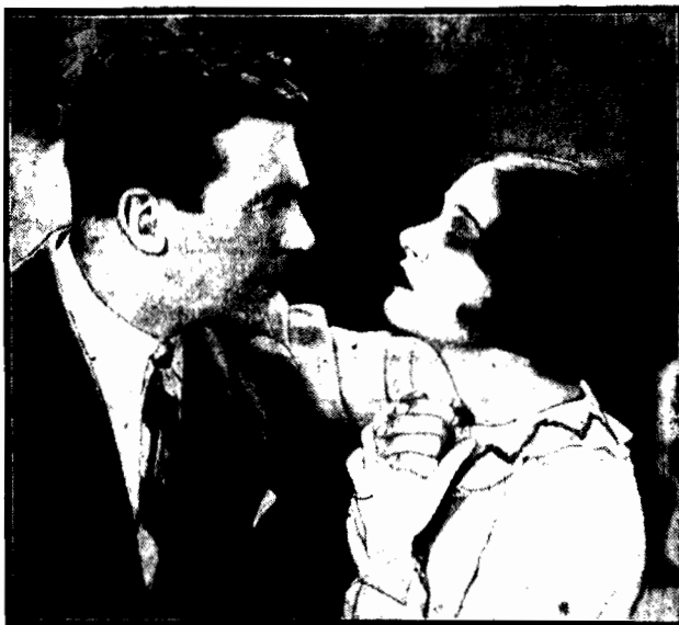
gwiazdki aktorki filmowej