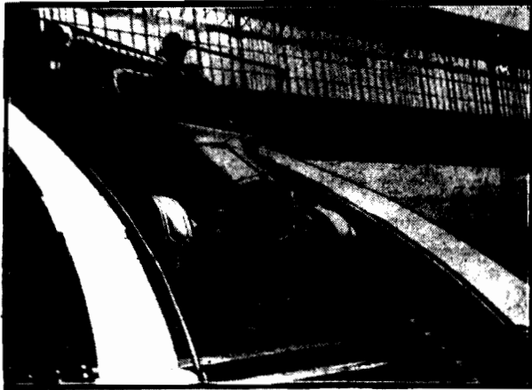
po schodach na rue d'Alsace urządził sobie akrobata paryski Rogeo.