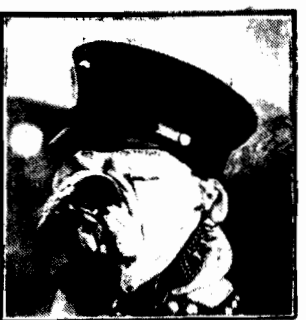
sa bukiogł, którym nie skąpi się nawet czapek marynarskiej