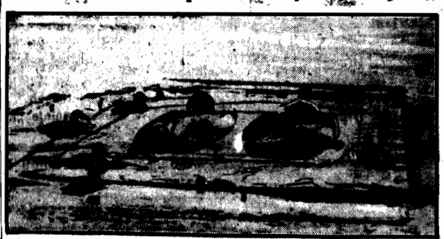
odbywa się nafięte w spochłbie wynalezionych łodziach, które...