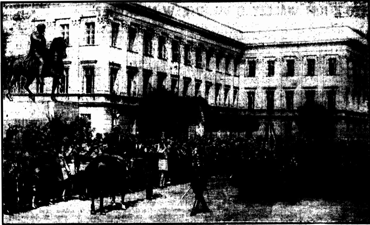
Punktem kulminacyjnym niedzielnych uroczystości była defilada wojsk i oddziałów przysposobienia wojskowego.

W związku z pogłoskami, obfity gajacemi całą prasę o propozycji prof. Kemmerera, dotyczącej likwidacji Banku Rolnego, dowiadujemy się z kół miarodajnych, że w sprawie tej zarówno prof. Kemmerer jak i jego współpracownicy nie wypowiedzieli się. Sprawa ta nie była również przedmiotem dyskusji w łonie Rządu. Pogłoski powstały na tle luznych propozycji, wysuwanych przez pewnych polityków.