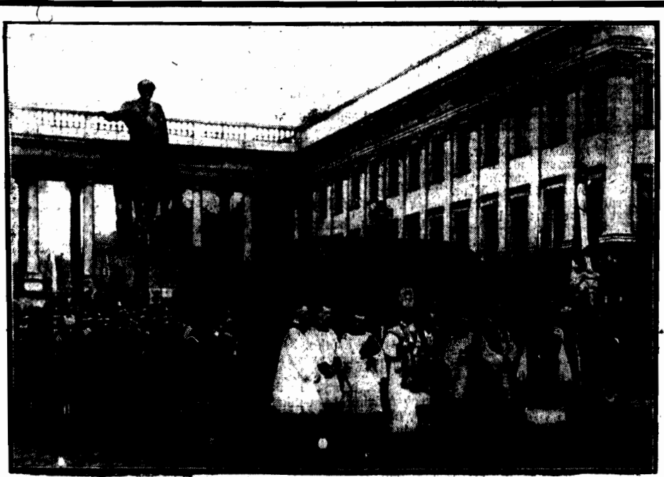
Msza polowa ołtarz awli ks. biskupa Gałł

MOSKWA, 16. 8. Ze względu na niewyraźną sytuację wewnętrzną, w całej Rosji sowieckiej wybory do Sowietów lokalnych odroczone do własny roku przyszłego.