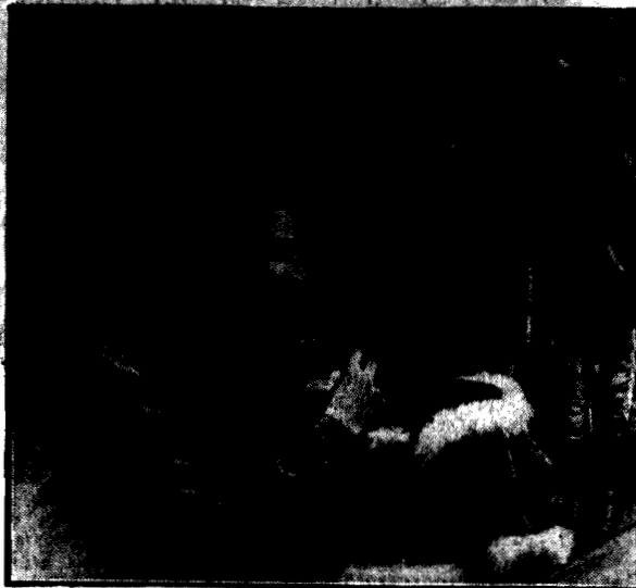
odbywa się narazie flirt z lalczkami.