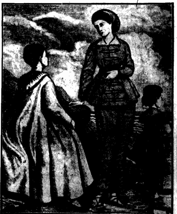
W takich strojach kąpały się niegdyś nasze prababki. W takich strojach chcieliby również widzieć współczesne kobiety, niektórzy nie si moralisji