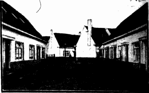
Ani jeden metr szczęśliwy takiemu domowi nie próżnuje. Przy minimum kosztów osiąga się maksimum wygody. Celowość i prostota otóż główne zalety tych domów. (Wywiad na str. 3-ej).