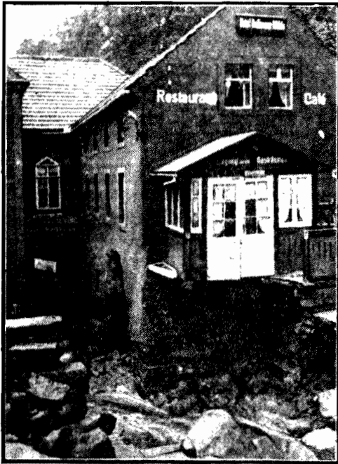
Dom ten niemal cały podmyła woda, rujnując wejście do restauracji