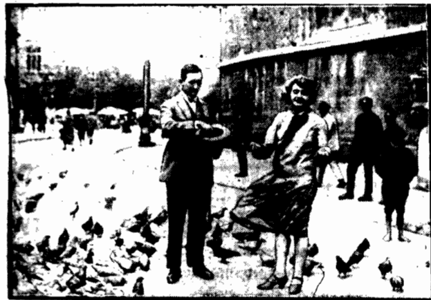
Karmienie gołębi kolo kościoła Marjańskiego w Krakowie.