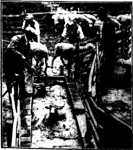
odbywa się na fermach angielskich pod dozorem policji.