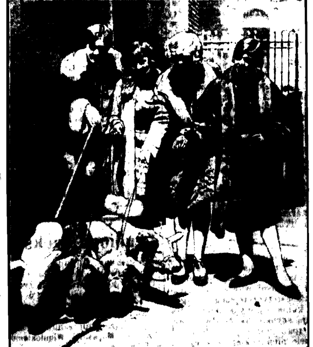
Oto cztery wesołe panny amerykańskie ze swoimi najnowszymi ulubieńcami.