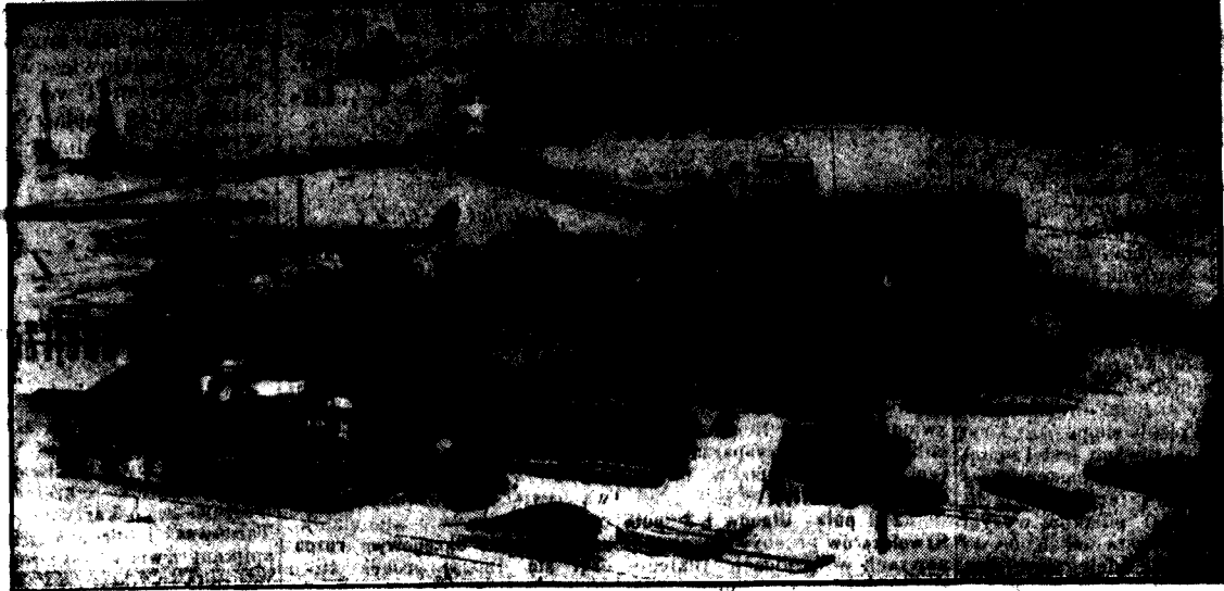
Rozbudowa portu naszego w Gdyni jakkolwiek postępuje naprzód, jest jeszcze sprawą dosyć odległą. Złazacza w chwili dzisiejszej, kie-

dy eksport polski wzmógł się tak znacznie. Gdynia tylko w części może podać ogólnym eksportowym zadanom.