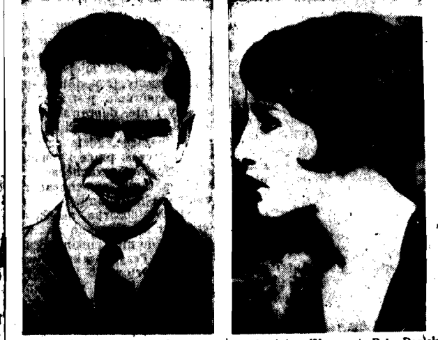
Stywna gwiazda kinematograficzna, ona wyszła zamąż za najlepszego krótko- na równoleż w Warszawie Bebe Danloz, dystansowca amerykańskiego Paddocka