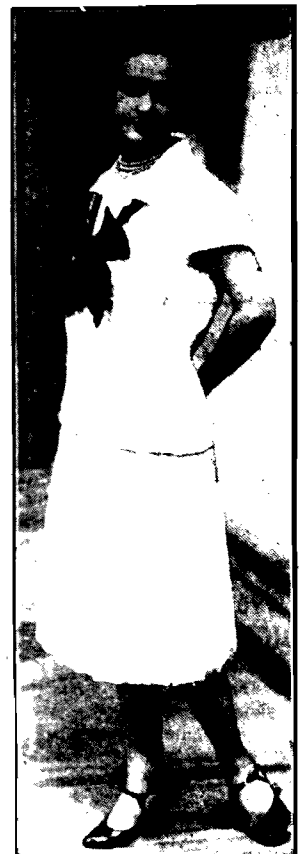
Actress S. Łaska, która wystąpiła w roli głównej w powieści „Czarna i biała” w Paryżu.