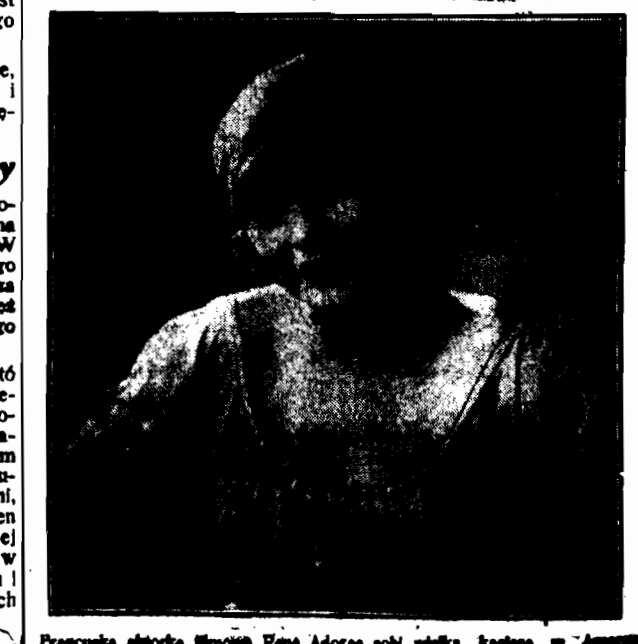
Przebiegła i piękna Młoda Pani Adama...