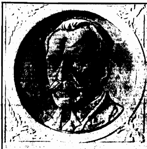
PREZYDENT PAŃSTWA POLSKIEGO IGNACY MOŚCICKI

W tych dniach ukończył znany artysta - rzeźbiarz, p. Głowiński podobiznę rzeźbiarską