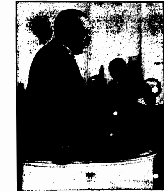
PREMIER RZĄDU P. KAZIMIERZ BARTEL w czasie wygłaszania znakomitego exposé.