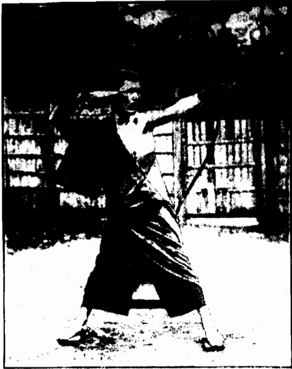
Przedstawicielstwo Kasa jest mek matym łucznikiem i z wyjątkiem przy urzędowej w ten sposób wypoczywa.