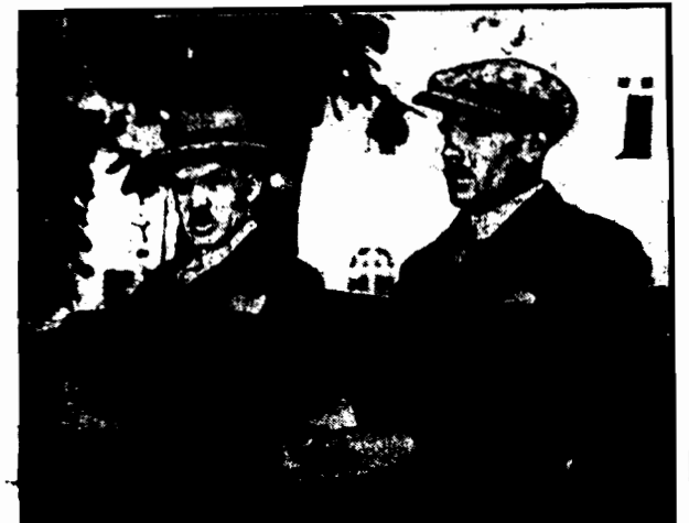
SYNOWIE PREZYDENTA RZECZYPOSPOLITEJ (opuszczają zinnach Sejmu).