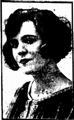
Fotografia przedstawia głośną artystkę francuską, ulubienicę stolicy nadsekwanskiej, Reginę Flory, o której niezwykle samobójstwie pisał wczorajszy Kurjer Czerwony.