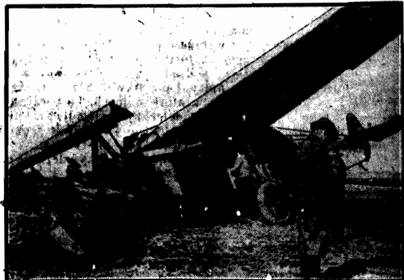
Po Byrdzie i Amundsenie chciał także amerykański lotnik kpt. Wilkins spróbować szczęścia w locie z Alaski do bieguna północnego. Przedsięwzięcie jednak jego nie udało się, gdyż przy pierwszym locie próbnym rozbił samolot.