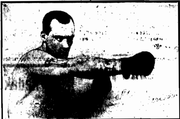
Świetny bokser szwedzki, mistrz Skandynawji wagi ciężkiej — Harry Persson — zmierzył się ostatnio z mistrzem Anglii tejże wagi — Phil Scott'em w walce o mistrzostwo Europy. Spotkanie odbyło się w Colbrook (Anglja). W jedenastej rundzie Persson — knockautował Scott'a, zdobywając tytuł mistrza Europy wagi ciężkiej. Na zdjęciu widzimy Perssona zaraz po zwycięstwie.