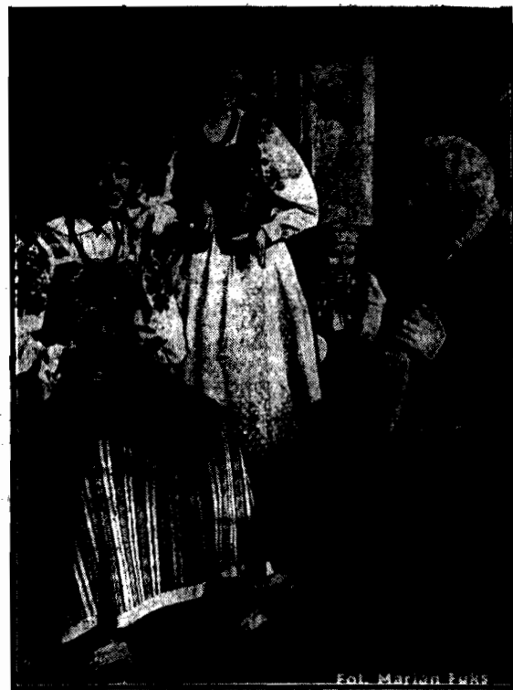
Grupa nielubiana, ludzka pozornia życia, prawdziwa w ruchu i wyrazie, to rodzina wiejska w strojach odświętnych, chwyciona w obiektyw fotografa nie na odpuszczeniu jarmarku dorocznym, ale... w gablocie Muzeum Etnograficznego. Coraz bardziej wychodzące z użycia, a tak piękne stroje krakowiaków, księżaków, mazurów, kurpiów, kujawiaków, przechowane tu są z należytym pietysmem i odtworzone ze ścisłością w najdrobniejszych szczegółach.