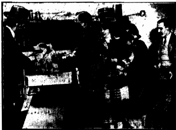
Magistrat amerykańskiego miasta Montclair wprowadził przymusowe szczepienie ochronne przeciw wściekliznie. Przydałoby się i w Warszawie.