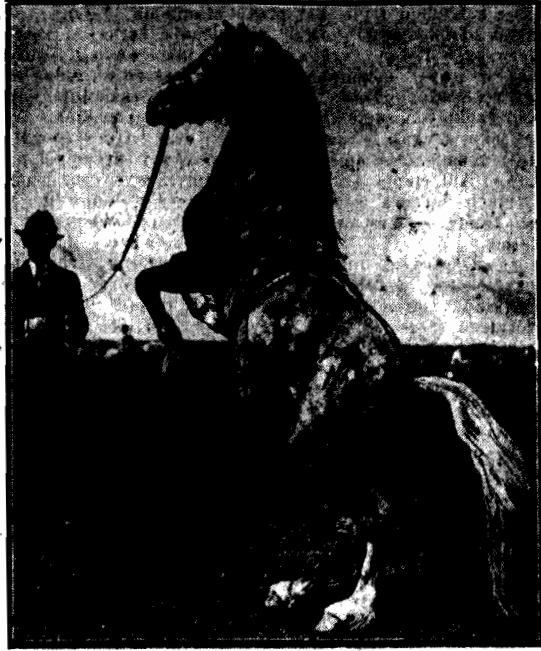
Woliński kuc „Lewyn Temptation” odznaczony pierwszą nagrodą.