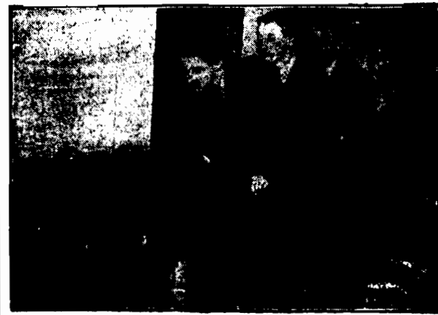
Na londyńskiej wystawie kolejowej trzy młodzi konstruktorzy wybudowali małą lokomotywę, która jednak jest tak silna, że z łatwością prowadzi całą kolejkę wynalazczą.