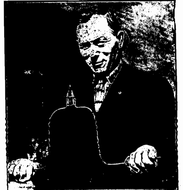
Jeden z kalifornijczyków skonstruował różdżkę szczęścia, która wskazuje, gdzie są ukryte skarby. Oparta jest ona na tym samym systemie, co różdżki wskazujące źródła wody i działa tem silniej, im większe są odkryte skarby. Ten niezwykły fenomen jest przedmiotem badań profesorów miejscowego uniwersytetu.