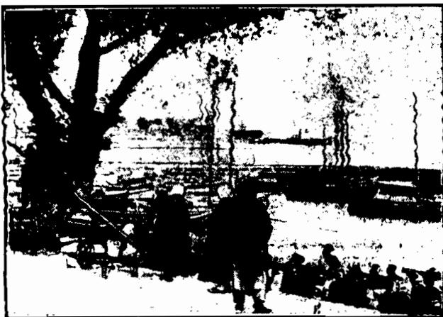
Jarz w porcie klajpedzkim.