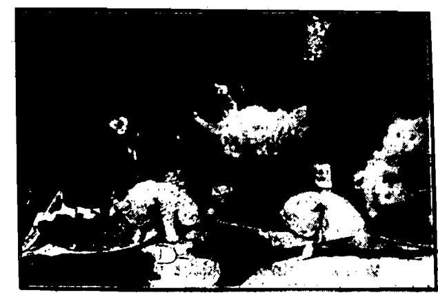
Nieprzepraszaj sobie na głowę ze świętowania.