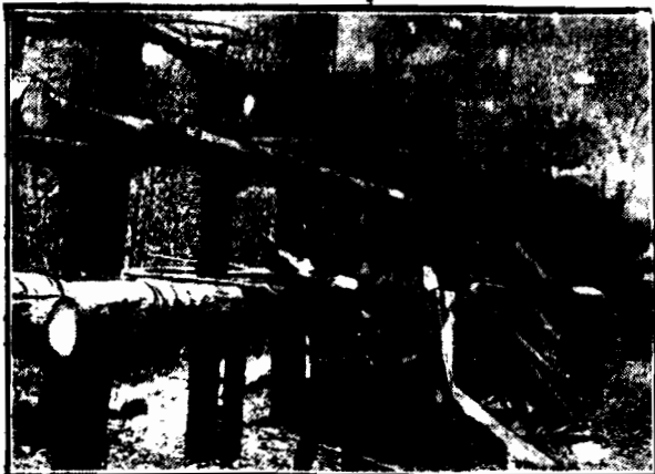
Na Cejlonie lów na dzikie słonie, odbywają się w ten sposób, że grupa łowców zapędza słonia na sztachety, mocno pobudowane, na których druga grupa krajowców razi słonia dzidami. Na ilustracji widzimy sztachety i krajowców, oczekujących pojawienia się słonia.