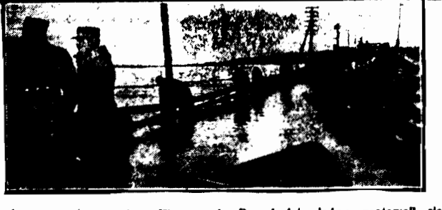
Pod naporem kry most na Wilji runął. Przechodnie ledwo uratowali się od utonięcia.

Nasampród w Rządzie, potem w Sejmie przyjdzie do rozprawy finansowej Exposé ministra Zdziechowskiego — dziś WARSZAWA, 23. III. Minister Zdziechowski, który według wczorajszej zapowiedzi p. Głabińskiego miał dziś na komisji budżetowej dać exposé o bieżącym stanie finansów, odrzucił wystąpienie swe do jutra przy okazji referatu pos. Michalskiego o preliminarzu ministerstwa skarbu.