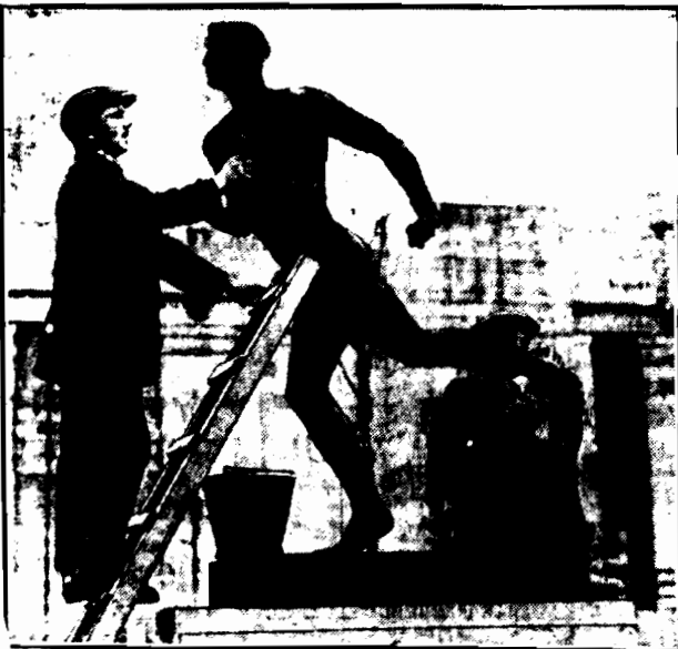
Słynny amerykański rzeźbiarz Willtam Richmond wykonał świeżo piękną rzeźbę, przedstawiającą maratońskiego biegacza.