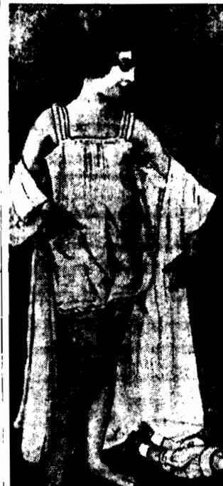
Młode dziewczynki już się dziękują jak ich mamusi, niedługo i u nich będzie tak samo.