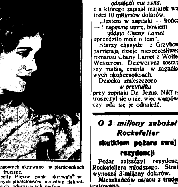
W czasach renesansowych ukrywano w pierścionkach truciznę. Dziś czasy się zmieniły. Piękne panie ukrywają w skrytkach efektywnych pierścionków małe ilości silnie działających perfum.

O 2 miliony zubożał Rockefeller skutkiem pożaru swej rezydencji. Pożar zniszczył rezydencję Rockefellera młodszego. Straty wynoszą 2 miliony dolarów. Mieszkańców pałacu z trudem uratowano.