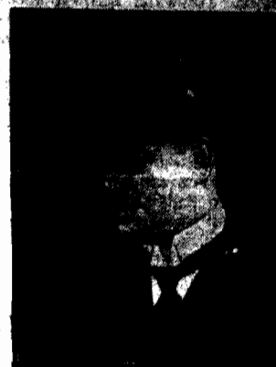
STRESEMANN „gentleman” (Patrz telegram z Genewy).

GENEWA, 11.3. Podkomitet komisji politycznej Zgromadzenia Ligi uchwalił jednogłośnie przyjęcie Niemiec do Ligi Narodów. Komisja polityczna będzie rozpatrywać tę sprawę jutro.