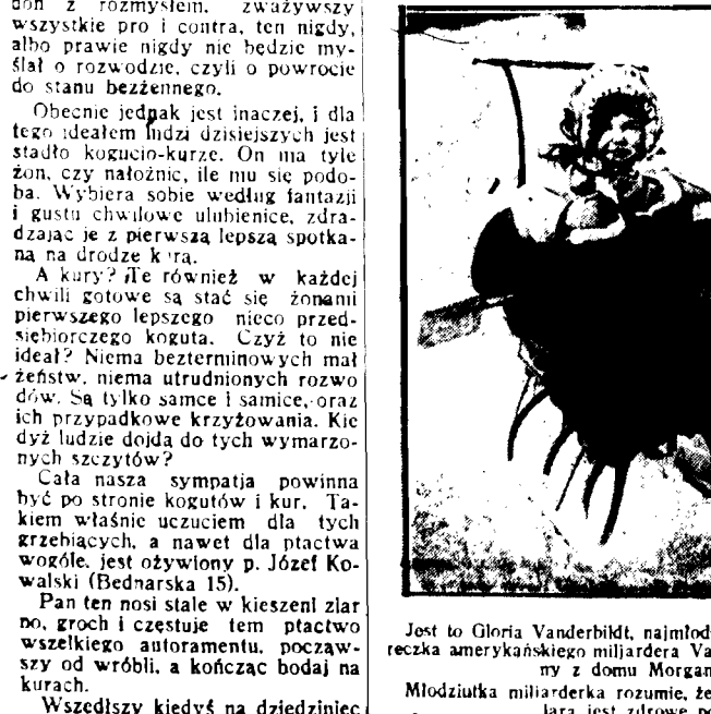
Jest to Gloria Vanderbilt, najmłodsza dwuletnia córka amerykańskiego miliardera Vanderbilta i jego żony z domu Morgan. Młodziutka miliardarka rozumie, że cenniejszym od dolara jest zdrowe powietrze.