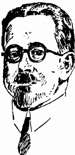
Alfonso da Costa Delegat republiki portugalskiej wybrany na przewodniczącego zgromadzenia Ligi Narodów.