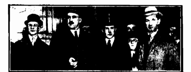
Minister Skrzyński na dworcu lyońskim w Paryżu przed wyjazdem do Genewy