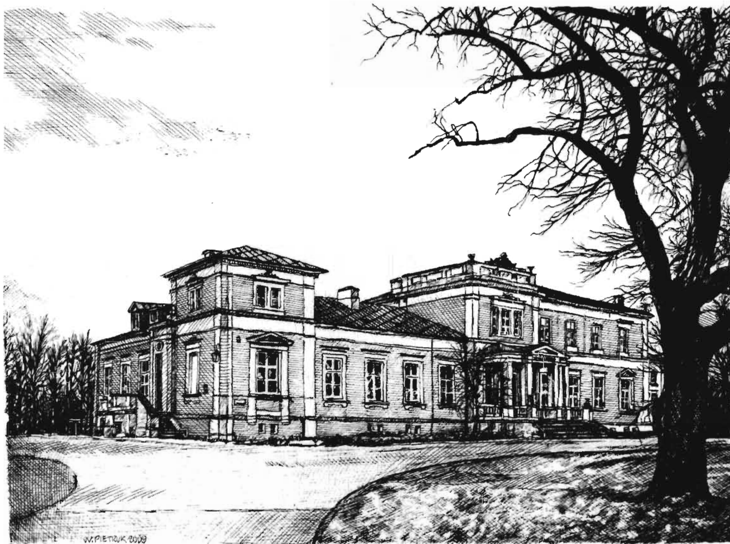
Ciechanowiec. Pałac neoklasycystyczny – mieści się tu Muzeum Rolnictwa im. ks. K.Kłuka Ciechanowiec, a Neoclassical Palace, now houses the Priest K. Kłuk Museum of Agriculture