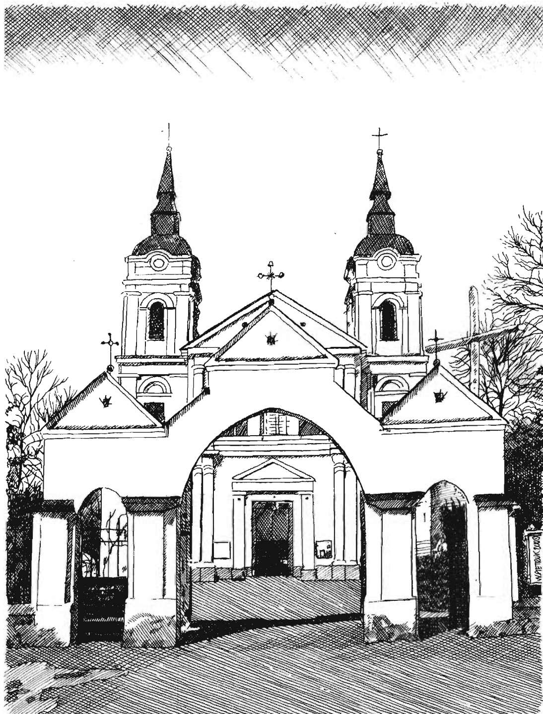
Parafia rzymskokatolicka pw. Św. Jana Chrzciciela, 18-200 Wysokie Mazowieckie, budowa kościoła lata 1875-1888 Saint John the Baptist Roman Catholic parish, built in 1875-1888, 18-200 Wysokie Mazowieckie