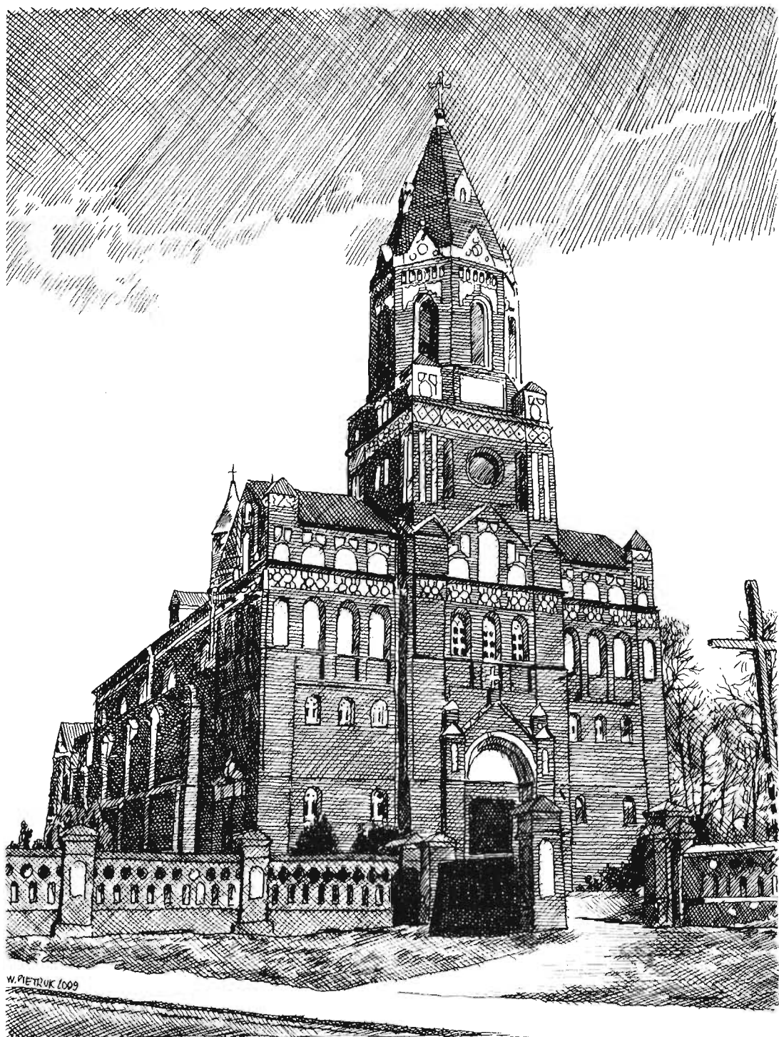
Parafia rzymskokatolicka pw. Zmartwychwstania Pańskiego, Kuczyn 62, styl neogotycki, budowa w latach 1888-1893 Resurrection of Christ the King Roman Catholic parish in Kuczyn 62, a Neo-Gothic church built in 1888-1893