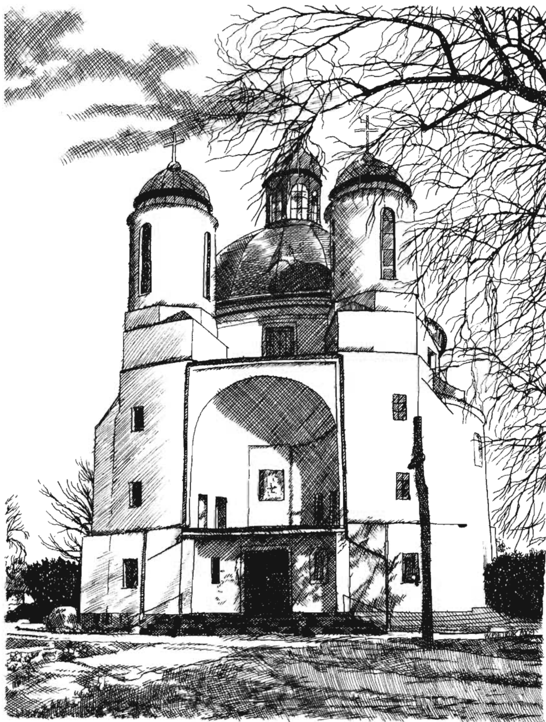
Parafia rzymskokatolicka pw. Wniebowzięcia NMP, Hodyszewo, budowa w latach 1933-1975 The Ascent of the Blessed Virgin Mary Roman Catholic parish in Hodyszewo, built in 1933-1975