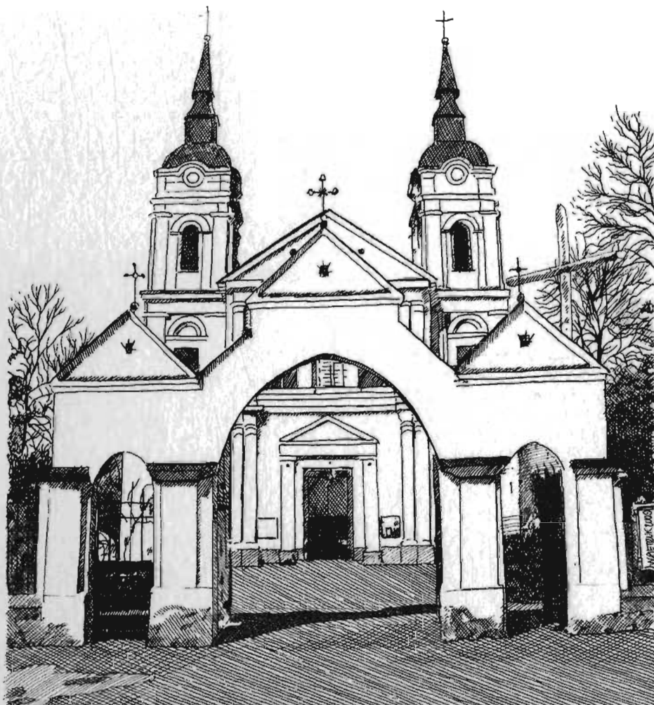
Parafia rzymskokatolicka pw. Św. Jana Chrzciciela, 18-200 Wysokie Mazowieckie, budowa kościoła lata 1875-1888 Saint John the Baptist Roman Catholic parish, built in 1875-1888, 18-200 Wysokie Mazowieckie