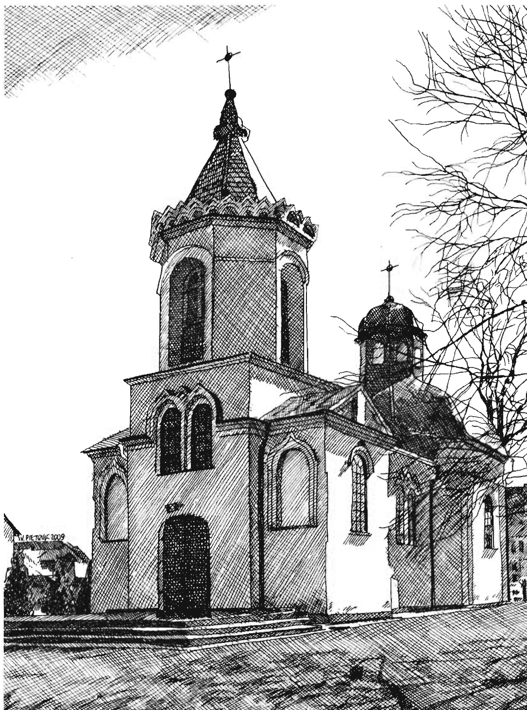
Murowany kościół pounicki w stylu bizantyjskim pw. Narodzenia NMP, zbudowany w 1798 r., odnowiony w latach 1996-1997 A brick, post- Eastern Rite, Byzantine-style Church of the Nativity of the Blessed Virgin Mary, built in 1798, renovated in 1996-1997