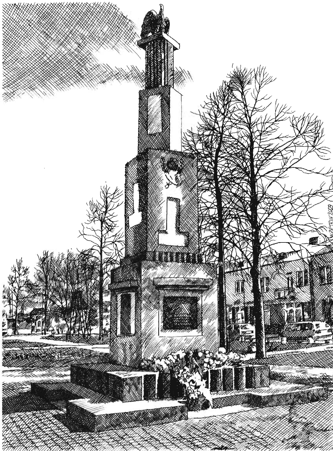
Pomnik POW zbudowany w 1928 r., „W hołdzie bohaterom poległym za wolność Polski w powstaniach narodowych 1794-1918 i w walkach z najazdem bolszewickim w 1920 r.” The Memorial of Polish Military Organization, built in 1928, “In tribute to heroes who died for Poland’s freedom in national uprisings 1794-1918 and fighting against Bolshevik invasion of 1920”