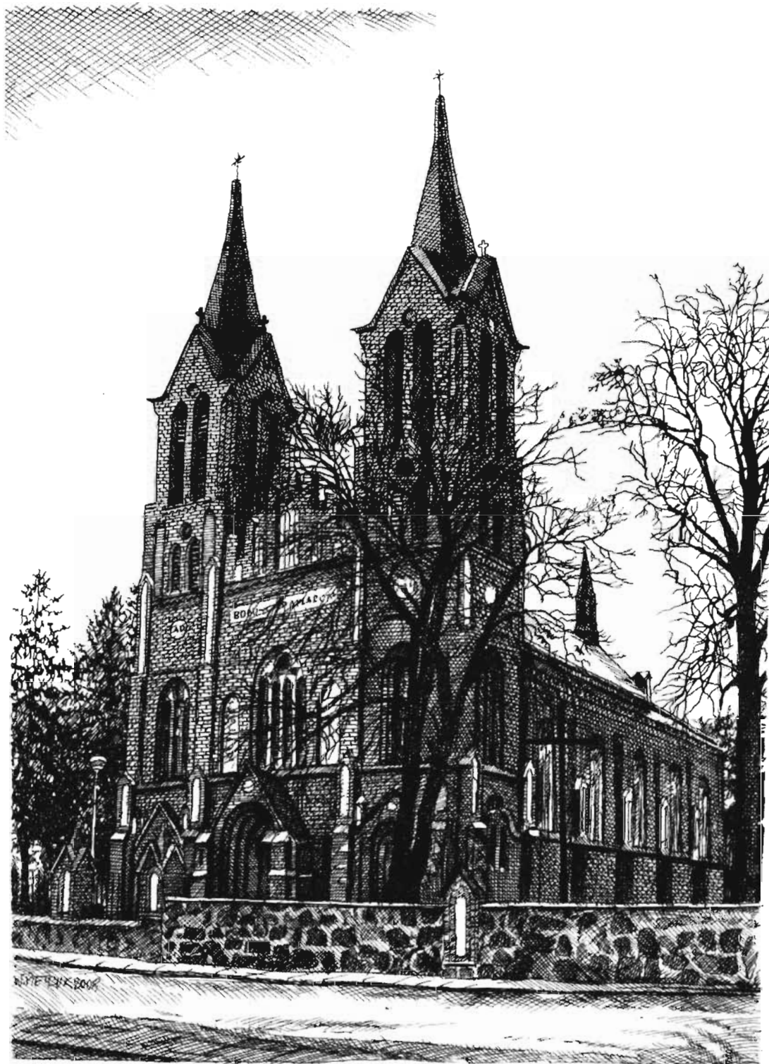
Parafia rzymskokatolicka pw. Św. Stanisława BM, Kobylin Borzymy, kościół w stylu neogotyckim, budowa w latach 1899-1904 The Saint Stanislaus Roman Catholic parish in Kobylin Borzymy, a Neo-Gothic church built in 1899-1904