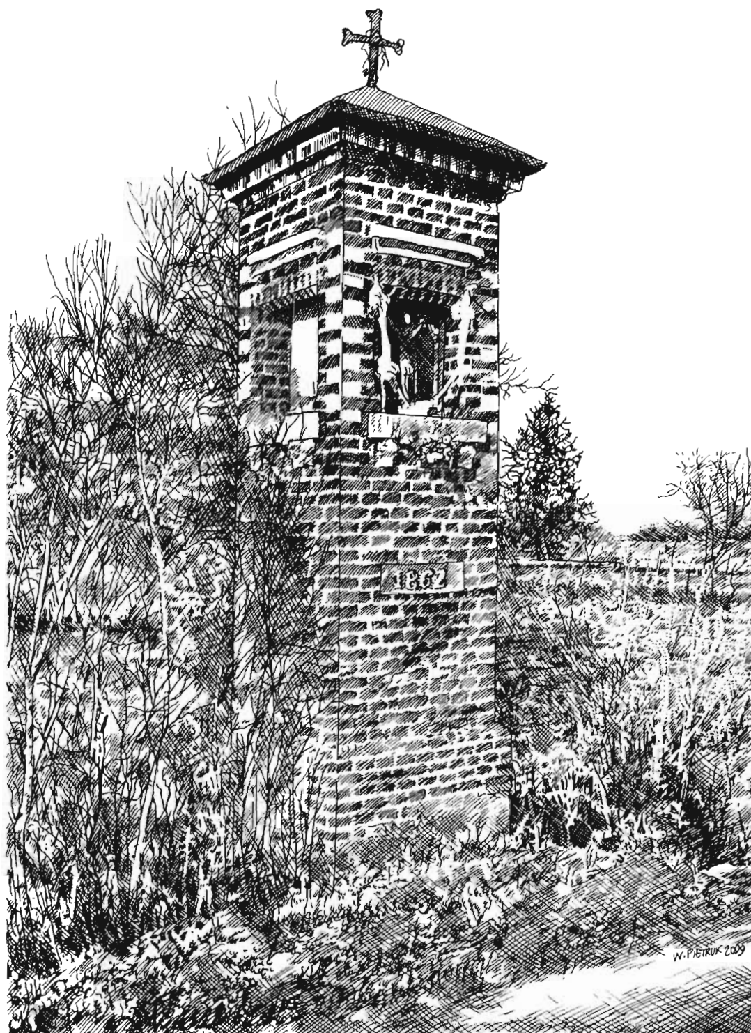
Szepietowo-Janówka, murowana kapliczka z 1862 r. Szepietowo-Janówka, a brick shrine of 1862