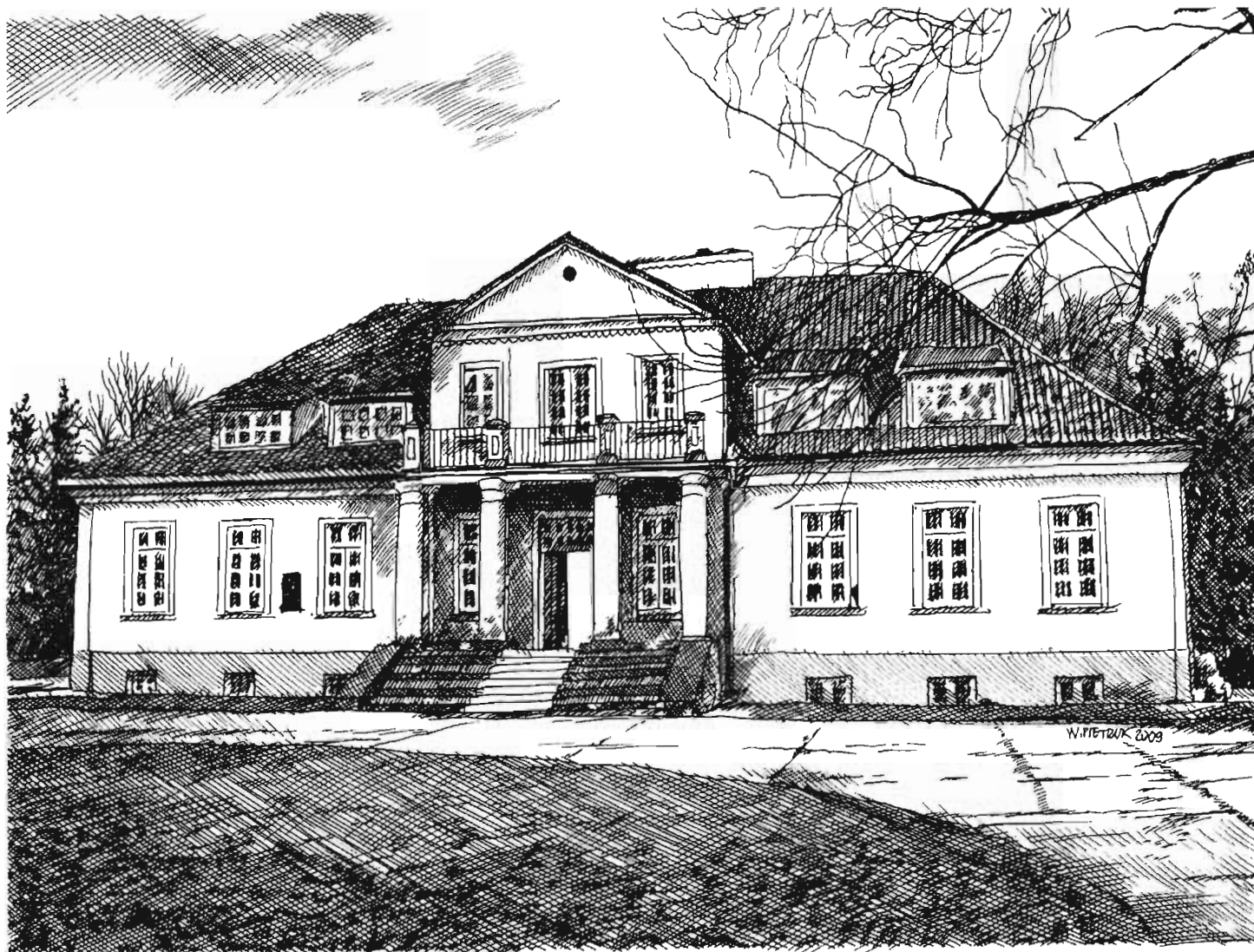
Dawny dworek rodziny Glogerów w Tyborach Kamionce A former manor house of the Glogers in Tybory Kamionka