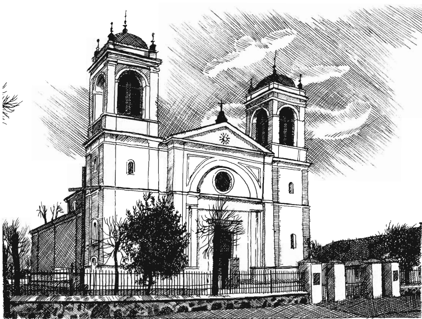
Parafia rzymskokatolicka pw. Św. Piotra i Pawła w Czyzewie, budowa w latach 1869-1874 The Saint Peter and Paul Roman Catholic parish in Czyzew, built in 1869-1874