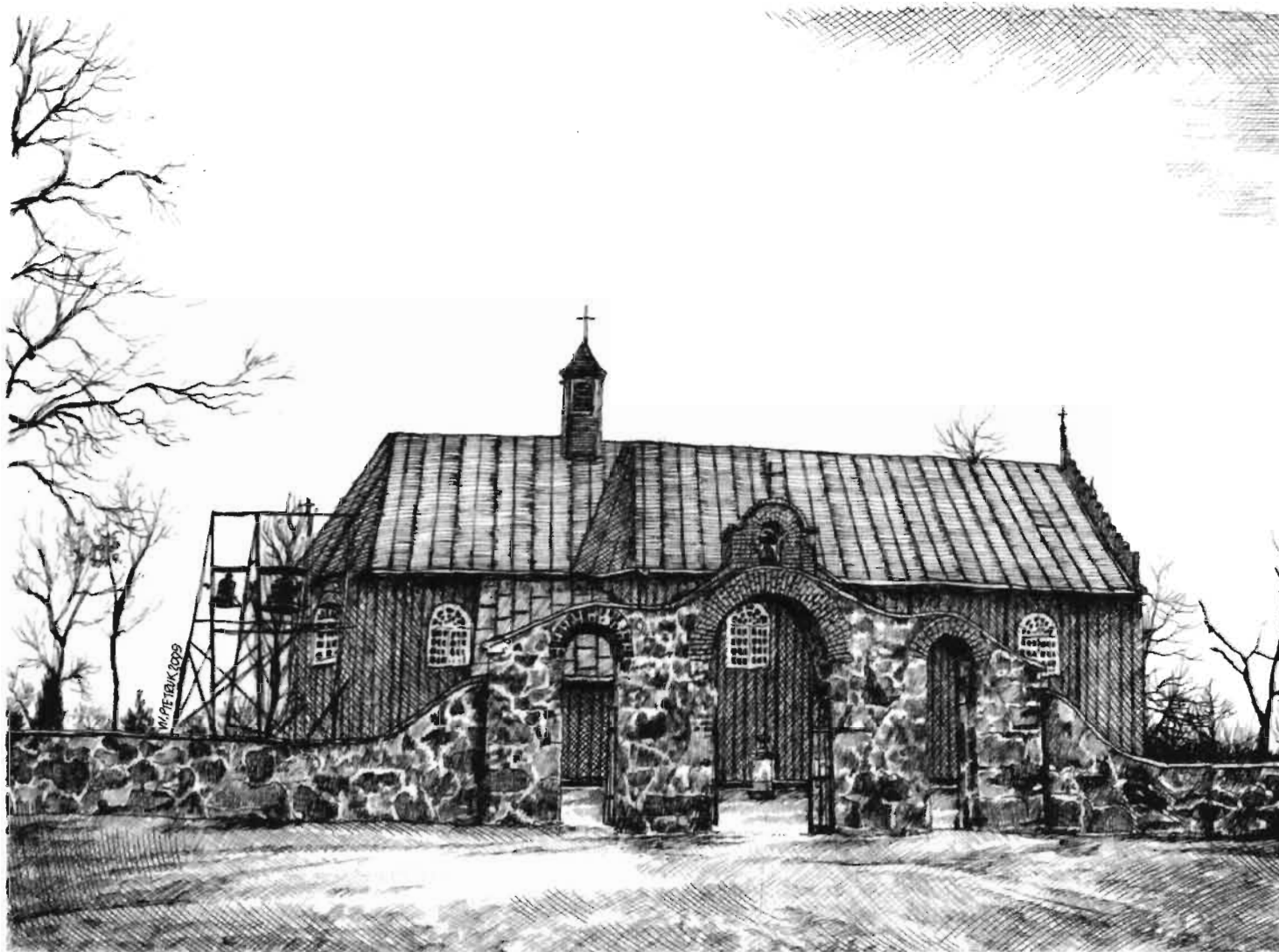
Kościół Winna Poświętna, parafia rzymskokatolicka, XVII-wieczny kościół drewniany pw. Św. Doroty, budowa 1696 r. Winna Poświętna, the Saint Dorothy Roman Catholic wooden church, built in the 18th century, in 1696