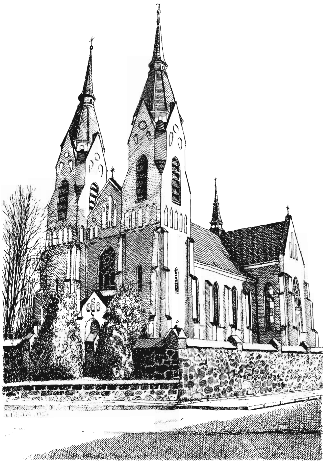
Parafia rzymskokatolicka w Kuleszach Kościelnych The Roman Catholic parish in Kulesze Kościelne