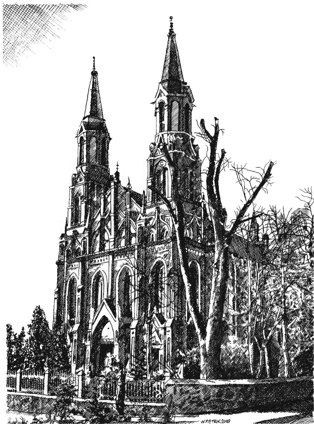
Parafia rzymskokatolicka pw. Wniebowzięcia NMP Sokoły, kościół w stylu neogotyckim, budowa w latach 1906-1912 The Ascent of the Blessed Virgin Mary Roman Catholic parish in Sokoły, a Neo-Gothic church built in 1906-1912