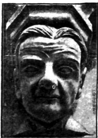
Rzeźba, wyobrażająca głowę angielskiego polityka Baldwina została użyta jako kapitał kolumny w budowanej obecnie katedrze w Chichester w Anglii.