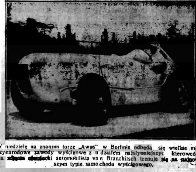
Trening przed zawodami

Na posiedzeniu Rady miejskiej m. Lwowa wywizowała się dłuższa dyskusja w sprawie wystawienia na scenie teatru Wielkiego sztuki sowieckiego pisarza Tretiatkowa p. t.: „Krzyżce Chiny”.