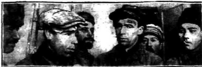
Typy robotników, pracujących przy budowie Dnieprostroju.

procent bezrobotnych, głodnych; stoi w obliczu ruiny materialnej, a mimo swych demokratycznych hasel wszystkie wystąpienia głodnych likwiduje — ogniem karabinów maszynowych... Miliony ludzi nie mają co jeść, a jednocześnie zboże topi się, lub używa jako paliwa do lokomotyw... Do niedawna w uprzemysłowie-