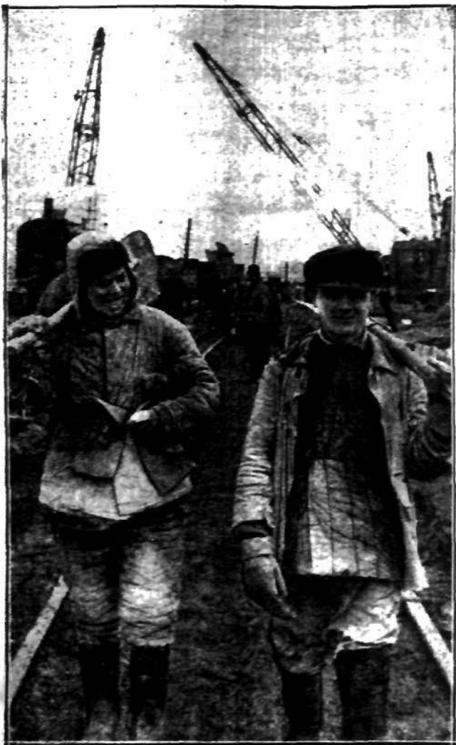
Trudno domyślić się, czy robotnicy sowieccy istotnie tak pogownie idą do pracy, czy jest to poprostu — zdjęcie propagandowe... (Do artykułu obok).

jednakże twórcy tego giganta twierdzą, kto wie, czy nie nabryk entuzjastycznie, że wszystko to zostanie zamortyzowane w ciągu niespełna — 4 lat. I w ciągu tego okresu cała Ukraina ma się przemienić w kraj najlepiej, najbardziej zelektryfikowany na świecie. Czy będzie tak istotnie, czas pokaże. Narazie, odrzucając wszelkie animozje polityczne, trzeba stwierdzić, że dokonano wielkiego dzieła. Ten.