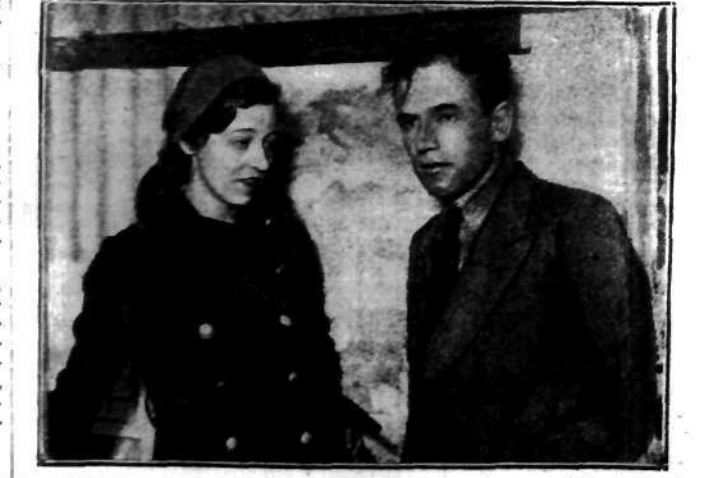
Aukcja lotnicza Amy Johnson zareczyniła się ze słynnym z lotu do Atryki Jotnikiem Mollisonem.