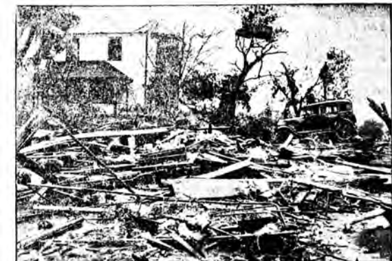
Nad stanem Alabama przeszedł straszliwy w swych skutkach tornado, który zniszczył i kilkanaście miast, kilkanaście wsi i pogrzebał pod gruzami setki osób.