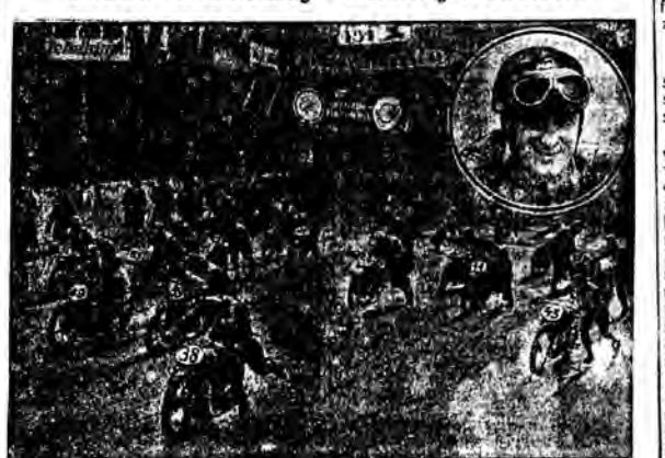
Chwila startu międzynarodowego wyścigu motocyklistów pod Hannoverem. U góry: Zwycięzca Banhofer (DKW).