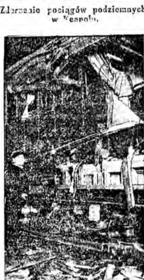
Kolei pociągowej w Neapolu zderzyły się dwa pociągi w całym pędzie. Na zdjęciu zderzone wagony, w których kilkunastu ludzi poniosło śmierć.