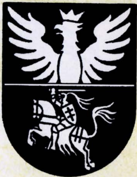
27. Herb Białegostoku w Wielkiej Encyklopedii Powszechnej PWN z 1962 r., Wielka Encyklopedia Powszechna PWN, Tom I, Warszawa 1962

Brak uregulowanych spraw herbowych prowadził do pewnego chaosu informacyjnego. Zwraca uwagę ukoronowana część orła w górnym polu.