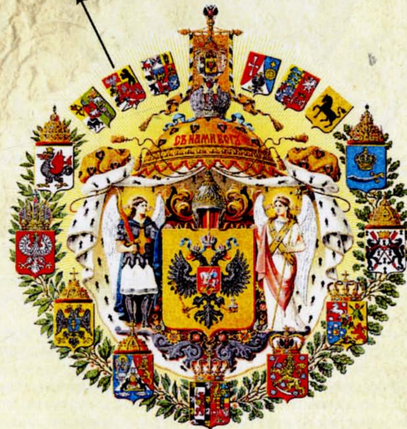
16. Herb Wielkiego Cesarstwa Rosyjskiego, 1882 r., http://pl.wikipedia.org/wiki/Herb_Rosji dostęp dnia 14.05.2012 r.

Z czasem pojawiła się możliwość odstąpienia od wersji herbu z 1845 r. Car Aleksander III dwoma ukazami w 1882 r. ustalił poczet tytułów cesarskich i opis wielkiego herbu cesarstwa rosyjskiego. Pośród tytułów przysługujących cesarzowi znalazł się tytuł „księcia białostockiego” a na jednej ze zbiorowych tarcz umieszczono herb księstwa białostockiego.