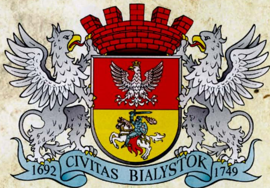
32. Dostojna wersja herbu Białegostoku, 1995- http://www.bialystok.pl/906-symbole-miasta/default.aspx dostęp dnia 14.05.2012 r.

Obecny kształt herbu miasta uregulowała uchwała Rady Miasta nr XIII/76/95 z dnia 27 lutego 1995 r. mówiąca, że Herb miasta będzie wyglądał następująco: Tarcza Herbowa dzielona w pas. Część górna czerwona, dolna złota. Na części górnej orzeł srebrny w koronie złotej, ze złotym dziobem i szponami oraz czerwonym językiem. W części dolnej Pogoń Litewska, której koń jest srebrny ze złotą uprzężą i czerwonym trójdzielny czaprakiem. Jeździec w zbroi niebieskiej, szyszak niebieski z otwartą przyłbicą i srebrnym piórem, miecz wzniesiony niebieski, ostrogi złote. Tarcza jeźdźca niebieska, na niej srebrny krzyż jagielloński. W dostojnej wersji herbu dwa srebrne gryfy trzymają tarczę herbu, a nad nią koronę miejską. Pod tarczą wstęga srebrna z napisem CIVITAS BIALYSTOK