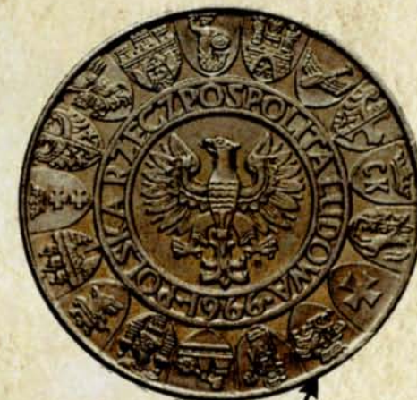
29. Awers i rewers pamiątkowej monety 100 zł wybitej z okazji 1000-lecia Państwa Polskiego