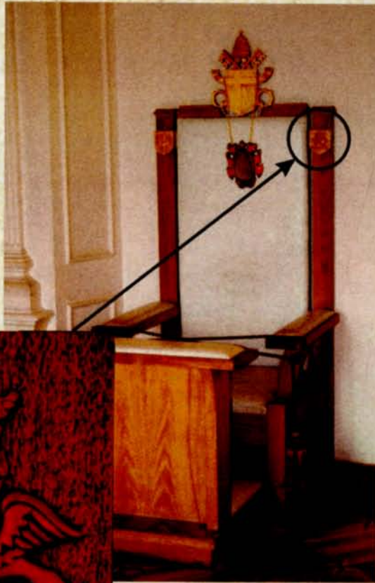
30. Herb umieszczony na fotelu papieskim wykorzystywanym w czasie wizyty Jana Pawła II w Białymstoku w dniu 5 VI 1991 r., fot. B. Samarski, 2012 r.

Co ciekawe dawny herb Białegostoku umieszczono na kartach wstępu do sektorów na lotnisku białostockiego aeroklubu w czasie pielgrzymki papieża Jana Pawła II do Białegostoku, która odbyła się 5 czerwca 1991 r. Umieszczono go także po lewej (dla patrzącego prawej) stronie oparcia fotela papieskiego, który stał przy ołtarzu w czasie mszy odprawianej przez Papieża na Krywlanach.