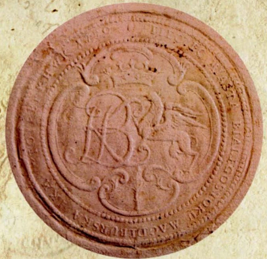
2. Pieczęć miasta Białegostoku magdeburgska, 1759, Archiwum Główne Akt Dawnych, Archiwum Piłsudskich-Giniatowiczów, nr zesp. 371, Zbiór pieczęci, sygn. B 20

Znajdujący się w księgach miejskich białostockich dokument odebrania w dniu 16 kwietnia 1752 r. przez nowego burmistrza dokumentów miejskich wylicza, że pośród różnych dokumentów nowy burmistrz otrzymuje pieczęć miejską, kasę oraz trzy księgi, prawdopodobnie wpisów spraw miejskich a także instruktarze. Najstarszym dokumentem na którym spotykamy ową pieczęć był akt donacji domu z placem w mieście Białymstoku z 23 sierpnia 1745 r. Na odcisku tej pieczęci występował jeleni wspięty w prawo (dla patrzącego w lewo) z rozłożonymi rogami, otoczony napisem „Sigill[um] civi[tatis] magd[eburgen?] [Biał]ostocen. Tę pieczęć spotykamy później na dokumencie miejskim wystawionym 8 czerwca 1760 r. Użyty na pieczęci znak jelenia był bardzo popularny w herbach ówczesnych miast. Ściśle wiązał się z krajobrazem i okolicą miasta.