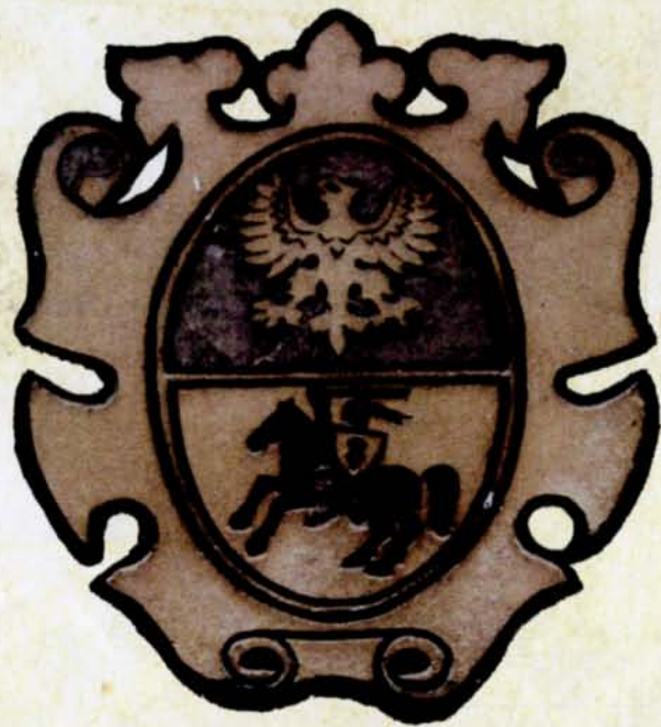
17. Stylizowany herb Białegostoku po 1966 r. podobny do herbu Księstwa Białostockiego, elewacja budynku przy Rynku Kościuszki 5A, fot. B. Samarski, 2012 r.

Herb przedstawiał się następująco: w górnym polu czerwonym orzeł srebrny, w dolnej części w złotym polu rycerz w niebieskiej zbroi z wzniesionym do ciosu mieczem i tarczą srebrną z krzyżem jagiellońskim, rycerz na koniu karym, czaprak czerwony z potrójną frędzlą złotą.