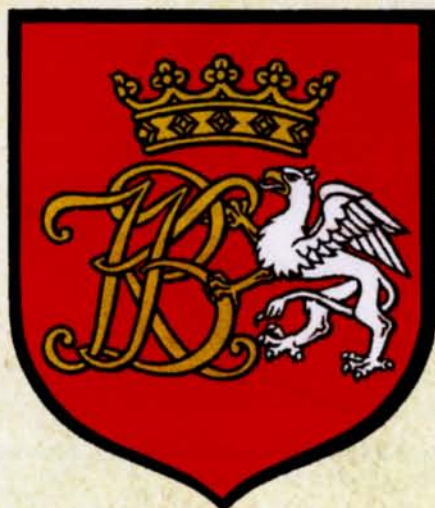
28. Herb Białegostoku w książce „Miasta polskie w tysiącleciu”, 1965 r., Miasta polskie w tysiącleciu, T. I, Wrocław-Warszawa-Kraków 1965

Brak uregulowanych spraw herbowych prowadził do pewnego chaosu informacyjnego. Zwraca uwagę ukoronowana część orła w górnym polu.