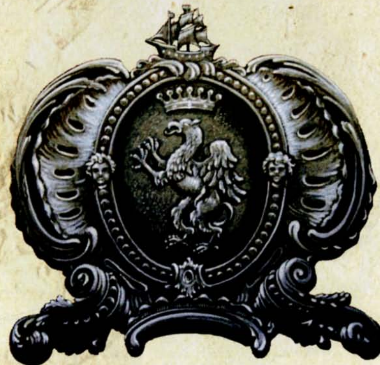
5. Gryf – nad wejściem do Aula Magna w Pałacu Branickich, fot. B. Samarski, 2012 r.

W życiu miasta ważne były oba herby. Informacje o sposobie ich wykorzystania znajdujemy we wspomnianym wyżej instruktarzu z 1745 r.: „(...) Gdy burmistrz pośle znak od domu do domu, który powinien być z herbem zamkowym i miejskim, zakazując na schadzce, a kto by nie miał stanąć przez ekskuzę słusznej ma podpadać grzywien – 3, (...) słowem we wszystkich punktach i okolicznościach ma zachować pospółstwo posłuszeństwo i rozkazy burmistrzowskie”.