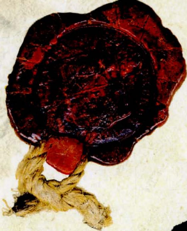
14. Pieczęć Białostockiej Gorodskoi Dumi (Rady Miasta Białegostoku), 1874 r., AP w Białymstoku, Akta stanu cywilnego Okręgu Bożniczego w Białymstoku, nr zesp. 264, sygn. 2