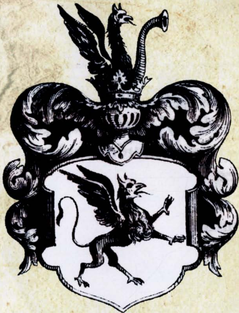
4. Gryf, Kasper Niesiecki, Herbarz Polski, Tom IV, Lipsk 1839

W herbarzu K. Niesieckiego zwraca uwagę fakt odwrócenia stron heraldycznych. Gryf skierowany jest dla patrzącego w prawo, natomiast powinien być dla patrzącego skierowany w lewo (heraldycznie w prawo). Podobnie ma się rzecz z wychylającymi się z korony gryfem i trąbą które również powinny być zamienione stronami, jak w przykładzie obok.