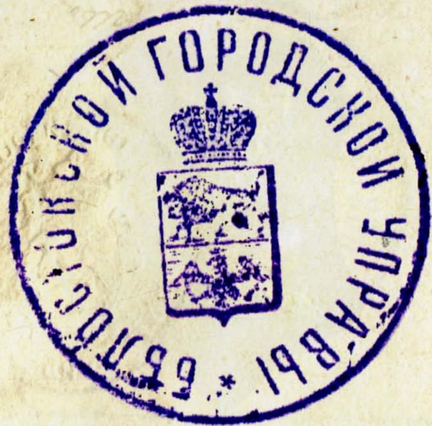
18. Pieczęć Rady Białegostoku, 1914 r., AP w Białymstoku, Akta miasta Białegostoku, nr zesp. 64, sygn. 6

Niestety księstwo białostockie nigdy nie istniało, a użycie tego tytułu wskazuje na chęć pomnożenia tytułów cesarskich w celach reprezentacyjnych. Innymi słowy herb księstwa białostockiego był to skasowany czterdzieści lat wcześniej herb obwodu białostockiego. Równie nieokreślona była właściwość tego herbu. Na pewno nie dotyczył samego miasta, najpewniej dotyczył terytorium jednak bez jasnego określenia w jakich granicach. Mieszczanie białostoccy szybko wykorzystali to niedomówienie i jeszcze w 1882 r. przyjęli herb księstwa białostockiego jako herb miasta. W taki sposób przywrócili do życia dawny herb obwodu białostockiego. Pozostaje tylko postawić pytanie jak wielką niechęcią był darzony poprzedni herb, który jak tylko nadarzyła się okazja błyskawicznie został zmieniony. Może kojarzono go, że jako herb także powiatowy był symbolem upadku znaczenia polityczno-administracyjnego miasta, a Białystok w tym czasie miasto powiatowe pod względem liczby ludności przewyższał gubernialne Grodno. Być może w grę wchodziły lokalne ambicje i chęć podkreślenia swojej odrębności i wspomnienie świetności miasta, a obecnie przeżywało niebywały rozkwit zyskując miano „Manchester Północy”.