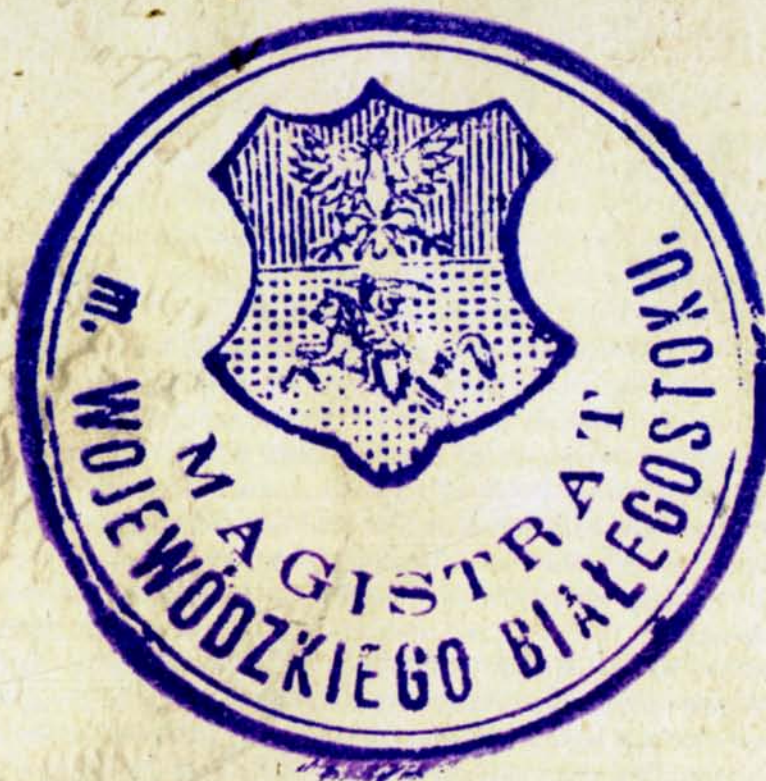
20. Magistrat miasta wojewódzkiego w Białymstoku, 1924 r., AP w Białymstoku, Akta notariusza Urbanowicza Bolesława w Białymstoku, nr zesp. 298, sygn. 18

Niekorzystny przebieg Wielkiej Wojny sprawił, że 13 sierpnia 1915 r. Rosjanie opuścili Białystok. Na ich miejscu pojawili się Niemcy, którzy na nowo zdobytych terenach powołali Militar Verwaltung Białystok-Grodno. Nowi okupanci bardzo sprawnie administrowali zajętymi terenami, po kilku dniach miasto otrzymało światło elektryczne i wodę, po dwóch miesiącach działały wszystkie urzędy, wprowadzono nowe przepisy porządkowe i podatki. W tym czasie najprawdopodobniej powrócono do herbu z Orłem i Pogonią. Ich wizerunek pojawił się m.in. na znaczkach pocztowych emitowanych w sierpniu 1916 r. przez Pośrednictwo Pocztowe w Białymstoku.