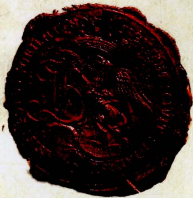
8. SIGILLUM CIVIT BIALOSTOCIENSIS BORUS ORIENT NOV, 1802, AP w Białymstoku, Kamera Wojny i Domen w Białymstoku, nr zesp. 2, sygn. 3104