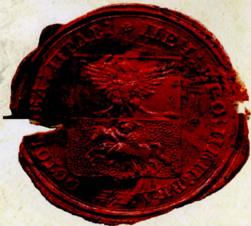
10. Pieczęć miasta Białegostoku, 1835 r., AP w Białymstoku, Sąd Okręgowy w Białymstoku, nr zesp. 277, sygn. 23