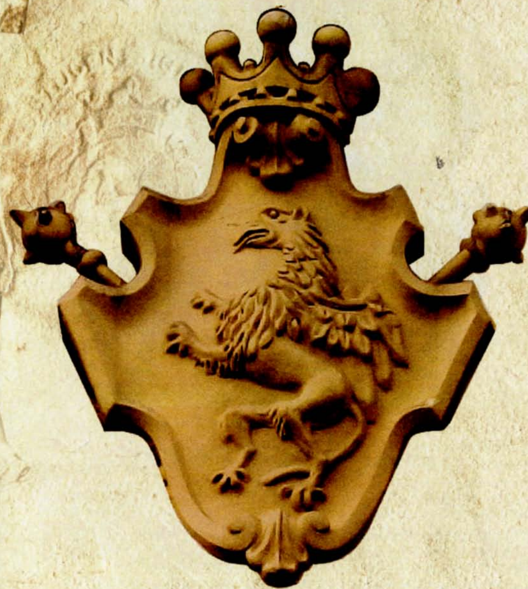
3. Gryf na elewacji Pałacu Branickich, fot. A. Gawroński, 2012 r.

Należy zaznaczyć, że wykorzystany w herbie miasta Gryf różnił się od Gryfa Branickich. Według J. Glinki różnica pomiędzy użytym w herbie miejskim Gryfem a Gryfem którym pieczętowali się Branickcy polega na tym, że Gryf Branickich nie stoi na gruncie lecz wyobrażony jest bez podstawy, z ogonem zadartym ku tyłowi, na tarczy herbowej oparta była korona otwarta z pięcioma fleuronami, z której wychylał się gryf z trąbą.