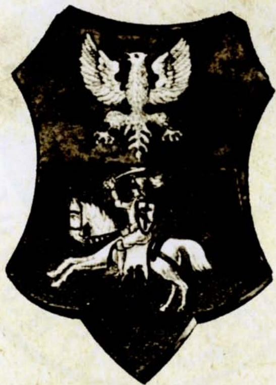
19. Herb Białegostoku, 1919 r., AP w Białymstoku, Akta miasta Białegostoku, nr zesp. 64, sygn. 133

Niekorzystny przebieg Wielkiej Wojny sprawił, że 13 sierpnia 1915 r. Rosjanie opuścili Białystok. Na ich miejscu pojawili się Niemcy, którzy na nowo zdobytych terenach powołali Militar Verwaltung Białystok-Grodno. Nowi okupanci bardzo sprawnie administrowali zajętymi terenami, po kilku dniach miasto otrzymało światło elektryczne i wodę, po dwóch miesiącach działały wszystkie urzędy, wprowadzono nowe przepisy porządkowe i podatki. W tym czasie najprawdopodobniej powrócono do herbu z Orłem i Pogonią. Ich wizerunek pojawił się m.in. na znaczkach pocztowych emitowanych w sierpniu 1916 r. przez Pośrednictwo Pocztowe w Białymstoku.