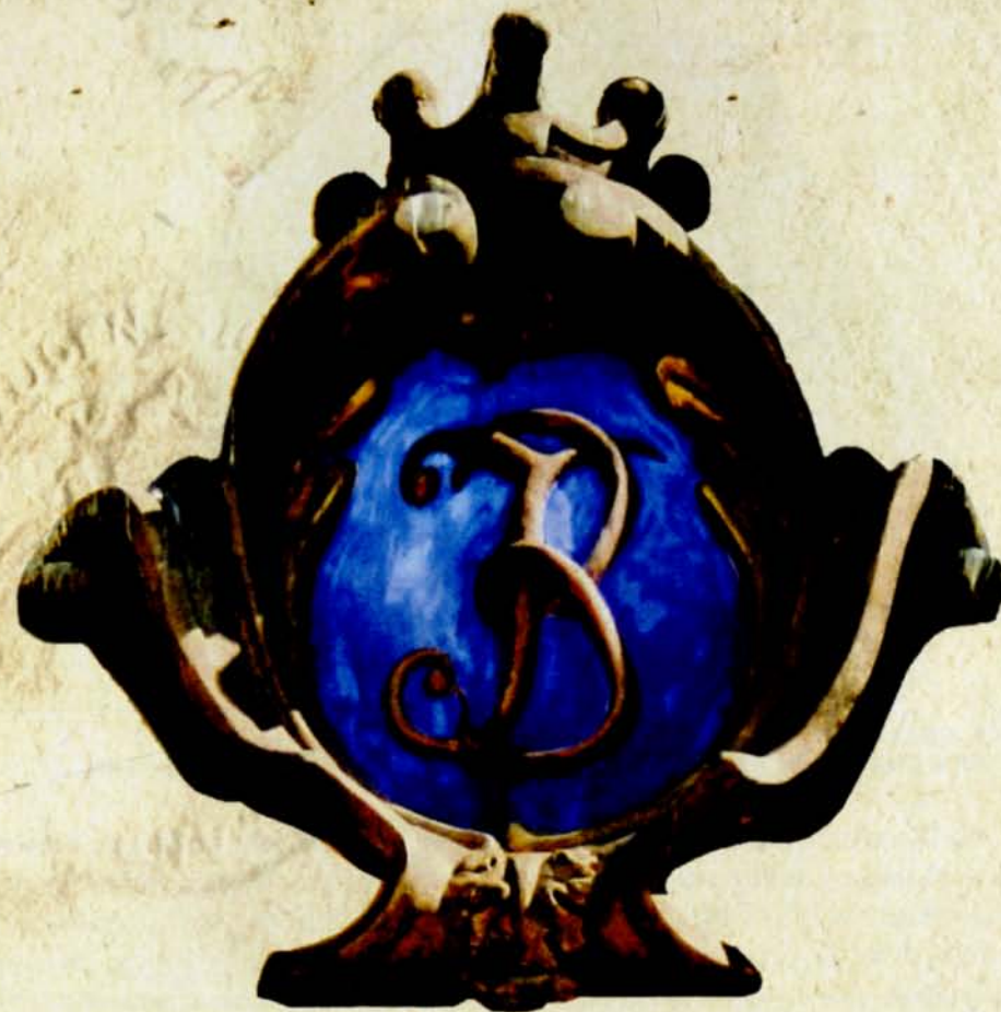
7. Ozdobny kartusz z inicjałami Izabeli Branickiej

Po śmierci Jana Klemensa Branickiego 9 października 1771 r. dożywotnią właścicielką miasta została jego żona Izabela z Poniatowskich. Pomimo trudności ekonomicznych wynikających z utraty sporej części dochodów męża Izabela dbała o pałac, miasto i jego mieszkańców. Prowadziła szeroką działalność kulturalną i oświatową, m.in. opiekowała się powstałą w 1777 r. w Białymstoku Szkołą Podwydziałową Komisji Edukacji Narodowej, szkołą parafialną, szkołą paziów. Podjęła też działania ograniczające samorząd miejski i wzmacniając pozycję własnego gubernatora. Kontrolował on nie tylko samorząd ale i landwójta, miał prawo sądenia i karania mieszczan, a jego głównym obowiązkiem było chronienie miasta przed niebezpieczeństwami z zewnątrz, sprawowanie nadzoru policyjnego, ingerowanie w razie pojawiających się konfliktów, zwłaszcza jeśli zagrożone były interesy dworu. Miasto czasy najświetniejszego rozkwitu miało już za sobą, a jego kryzys powiększyła jeszcze epidemia ospy oraz kilkakrotnie nawiedzające je pożary.