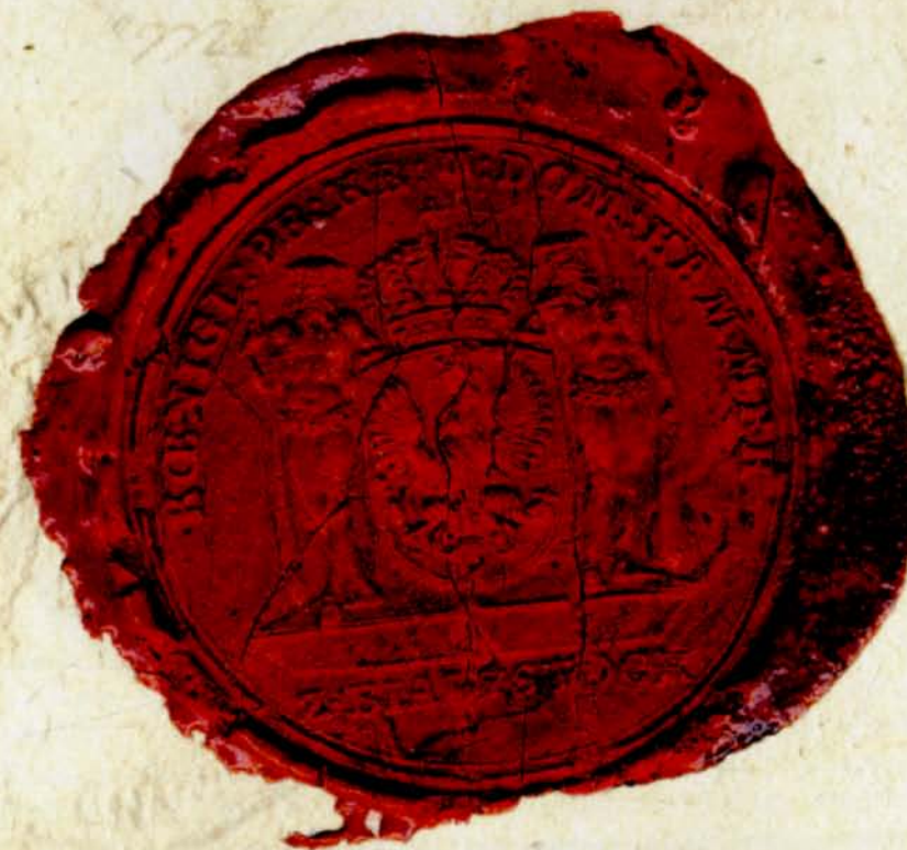
9. Pieczęć Kamery Wojny i Domen w Białymstoku, 1799 r., w otoku napis: Konigl. Pr. Kr. U Dom. Kammer z Białystok, AP w Białymstoku, Kamera Wojny i Domen w Białymstoku, nr zesp. 2, sygn. 3104

Działalność władz pruskich doprowadziła do całkowitej przemiany miasta – z zaplecza istniejącego dworu Branickich w centrum administracyjne departamentu. W 1802 r. zapadła decyzja o zmianie właściciela miasta. Pałac i miasto Białystok wraz folwarkami Wysokistok, Białystok, z wsiami Białostoczek, Hussowicze (Ussowicze), Ogrodniki, Słoboda, Starosielce, Szelachowka (Szelachowskie) i Zawady i wszystkimi powinnościami poddanych, czynszami i daninami przeszedł na własność króla Prus. Departamentem Nowych Prus Wschodnich zarządzała Kamera Wojny i Domen Nowych Prus Wschodnich, której pieczęć przedstawiała orła pruskiego na tarczy zwieńczonej zamkniętą koroną królewską, po bokach tarczy dwie postacie trzymaczy stojących na postumencie. W otoku napis Koenigliche RR u Domen Kammer z Bialystok. Nie wiadomo czy władze pruskie zmieniły herb miejski Białegostoku. Być może korzystano nadal ze starego. Znany jest przykład Goniądza, w którym nadal używano starego herbu, z dodanym w otoku napisem Kon. Neu-Ost. Stadt Goniondz.