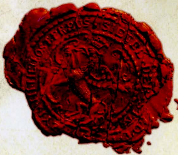
6. Gryf, AP w Białymstoku, Kamera Wojny i Domen w Białymstoku, nr zesp. 2, sygn. 3104