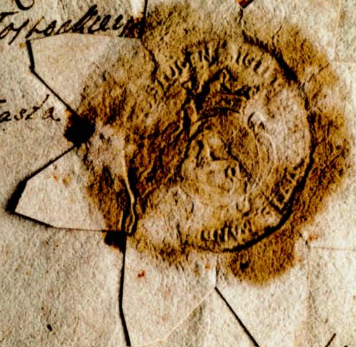
1. Sigill[um] [civi]tatis magd[eburgen] [Biał]ostocen, 1745, Archiwum Główne Akt Dawnych, Archiwum Roskie, nr zesp. 336, Akta rodzinno-majątkowe, sygn. 628

...ki Białostocki, podziurawiony. ...kami W... ...ry z... ...Tos... ...iasta