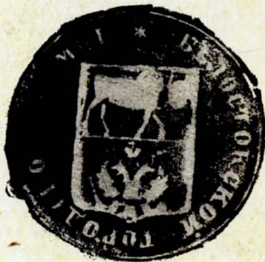
15. Pieczęć Białostockiej Gorodskoi Dumi (Rady Miasta Białegostoku), 1872 r., AP w Białymstoku, Akta stanu cywilnego Okręgu Bożniczego w Białymstoku, nr zesp. 264, sygn. 73

Zgodnie z rozporządzeniem Białystok musiał przyjąć herb powiatowy jako własny herb miejski. Herb oficjalnie stosowano z pewnymi wyjątkami aż do 1915 r. Jednym z takich wyjątków stanowiło pojawienie się po powstaniu styczniowym herbu miejskiego w wersji z dwugłowym orłem rosyjskim w dolnym polu.