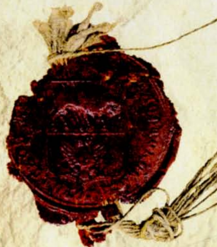
12. Pieczęć Rady Miasta Białegostoku, 1856 r., AP w Białymstoku, Akta stanu cywilnego Okręgu Bożniczego w Białymstoku, nr zesp. 264, sygn. 14

Obwód Białostocki istniał do 1842 r., kiedy zapadła decyzja o włączeniu go do guberni grodzieńskiej, rozpoczynając nowy okres funkcjonowania miasta jako miasta powiatowego.