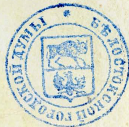
13. Pieczęć Białostockiej Gorodskoi Dumy (Rady Miasta Białegostoku), 1871 r., AP w Białymstoku, Akta stanu cywilnego Okręgu Bożniczego w Białymstoku, nr zesp. 264, sygn. 2

Zniesienie guberni niosło ze sobą likwidację wielu instytucji funkcjonujących w mieście, a to spowodowało odpływ części urzędników. Zmiana statusu administracyjnego miasta przyczyniła się do zmiany jego sytuacji ekonomicznej. Zlikwidowanie wielu urzędów spowodowało w mieście i okolicy spadek cen za ziemię, dzięki czemu zaistniały warunki do jego rozwoju ekonomicznego, już w latach 1843-1845 powstało w Białymstoku 11 manufaktur włókienniczych. W 1845 r. car Mikołaj I ustanowił herby gubernialne i powiatowe dla Grodna, Kowna, Mińska i Wilna. Rozporządzenie z 22 czerwca 1845 r. opublikowane w Zborze Praw Cesarstwa Rosyjskiego mówiło, że herby terytorialne przeznaczone są tylko dla miast znajdujących się na ich terytorium z wyłączeniem indywidualnych herbów miejskich. Na mocy tego rozporządzenia herby powiatowe stawały się właściwe dla miast powiatowych. Każdy herb powiatowy składał się z tarczy dzielonej w pas, w górnej części znajdowało się godło gubernialne a w dolnej miejscowe. W wielu przypadkach ustanowienie takiego wzoru herbu stanowiło przekreślenie a czasem zaprzeczenie dawnej tradycji ziem i miast. Według tego rozporządzenia herb powiatu białostockiego przedstawia w górnej części tarczy żubra jako herb guberni grodzieńskiej i w dolnej części orła w koronie.