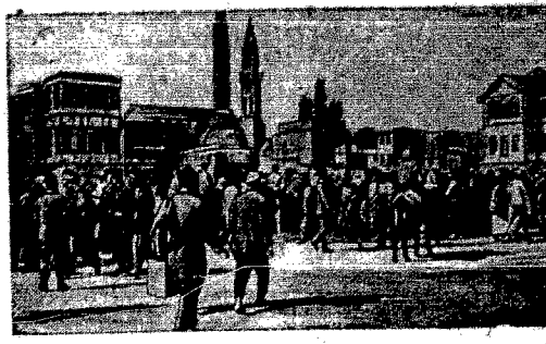
Plac w Damaszku (stolica Syrii)