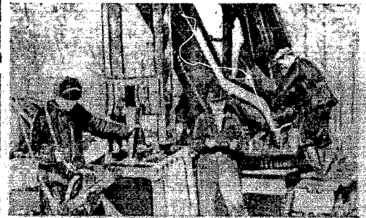
Минские ремонтные мастерские экскаваторной станции. Работники ССОР закончили ремонт экскаваторов, которые используются на мелиоративных работах.